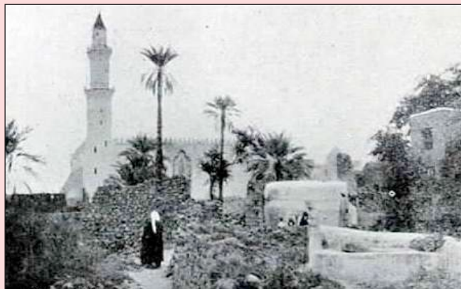
مسجد قباء (قديمًا)