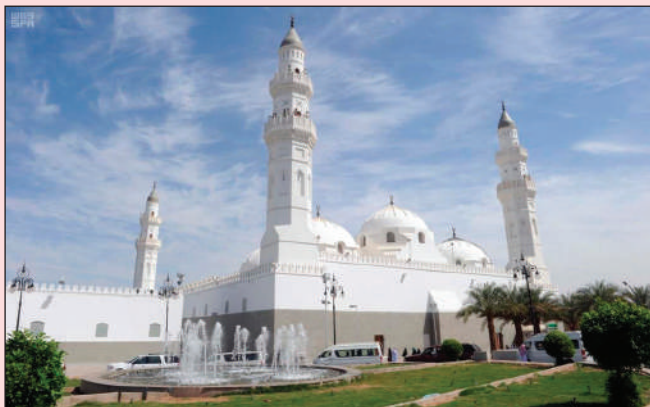
مسجد قباء (حديثاً)