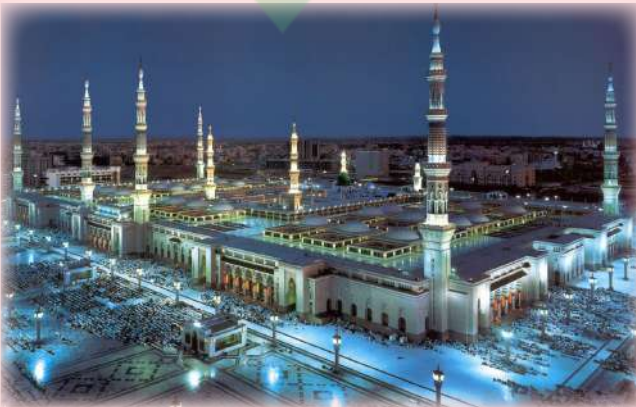
المسجد النبوي (حديثاً)