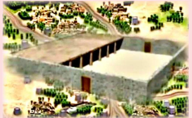
المسجد النبوي (قديمًا)