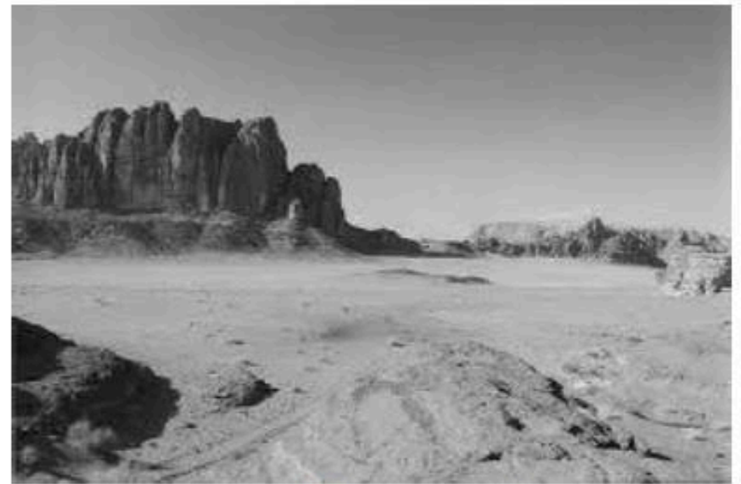
منظر لصحراء الجزائر

1-/- حدّد المكونات المحتملة لهذين المنظرين.