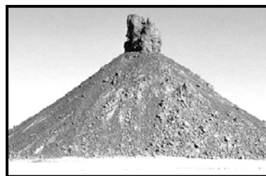
السند-5- بركان خامد من الهقار

التعليمة: بالاعتماد على معارفك و السندات :