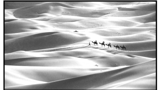
السند-2- تأثير الرياح