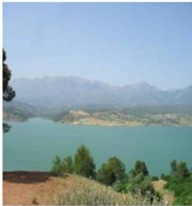
الوثيقة -4- بناء السدود والعناية بالغطاء النباتي