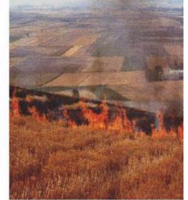
الوثيقة-1- حرق الغابات