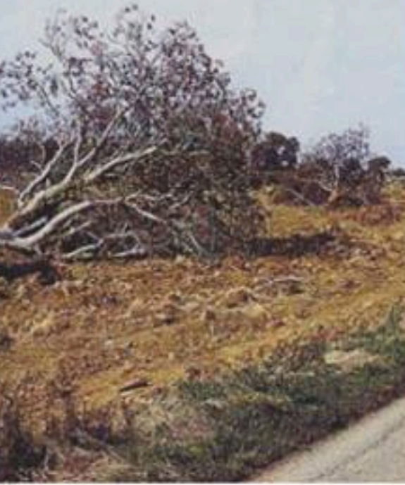
الوثيقة -3- قطع الأشجار