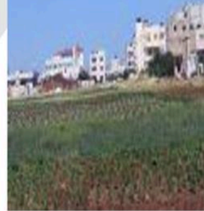
الوثيقة-2- التوسع العمراني