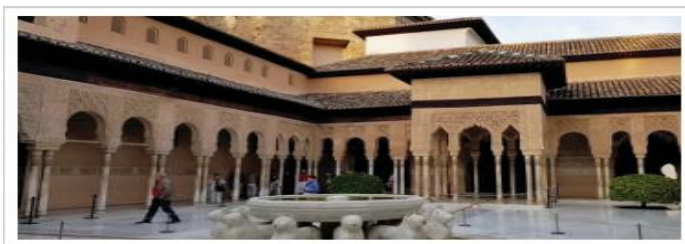
قصر الحمراء - إسبانيا