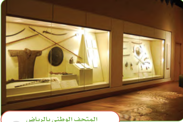
المتحف الوطني بالرياض

في وطني متاحف تضم أبرز القطع الأثرية وصوراً لمعالم تاريخية وثقافية من وطني. كما تقام بين حين وآخر معارض تبرز العناية الكبيرة فيما يقدمه وطني من أعمال وإنجازات.