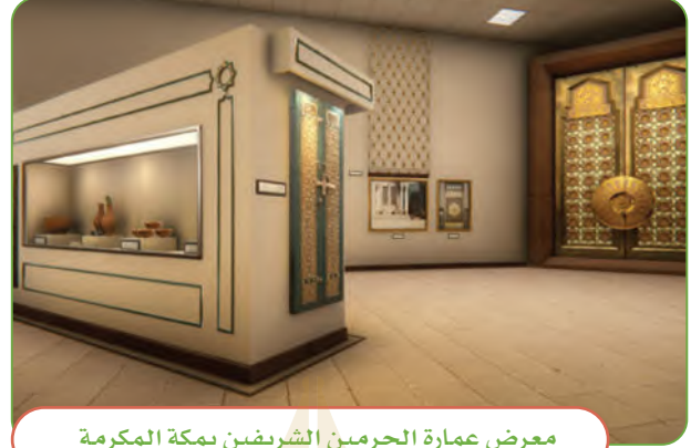
معرض عمارة الحرمين الشريفين بمكة المكرمة

أحافظ على الآثار في وطني المملكة العربية السعودية بتجنب التعدي عليها أو العبث بها، وإذا وجدت شيئاً منها أسلمه للجهة المسؤولة عن الآثار في وطني، وهذا دليل على محبتي لوطني وتقديري لتاريخه العريق.