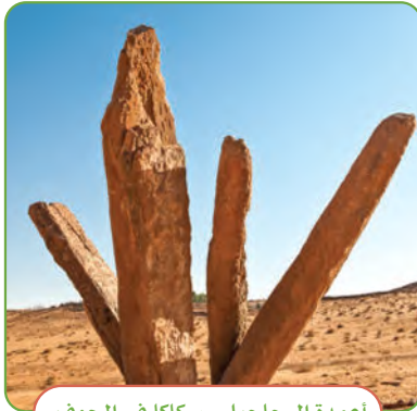
أعمدة الرجايل - سكاكا في الجوف

❖ دلمون على ساحل الخليج العربي، ومكانها القُطيف في المنطقة الشرقية.