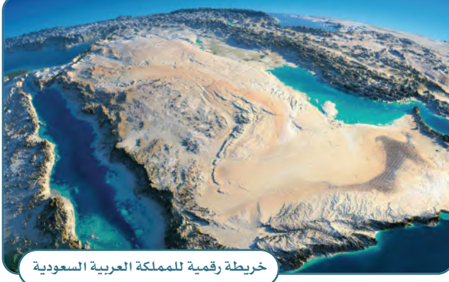
خريطة رقمية للمملكة العربية السعودية