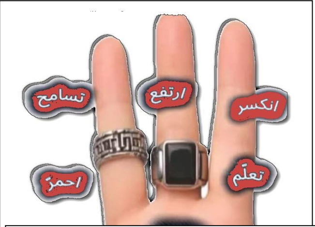
مزيد ثلاثي بحرفين الهمزة و النون / الهمزة و التاء / الهمزة و التضعيف / التاء و الألف / التضعيف