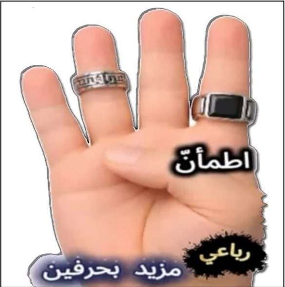
مزيد رباعي بحرفين (الهمزة و التضعيف)