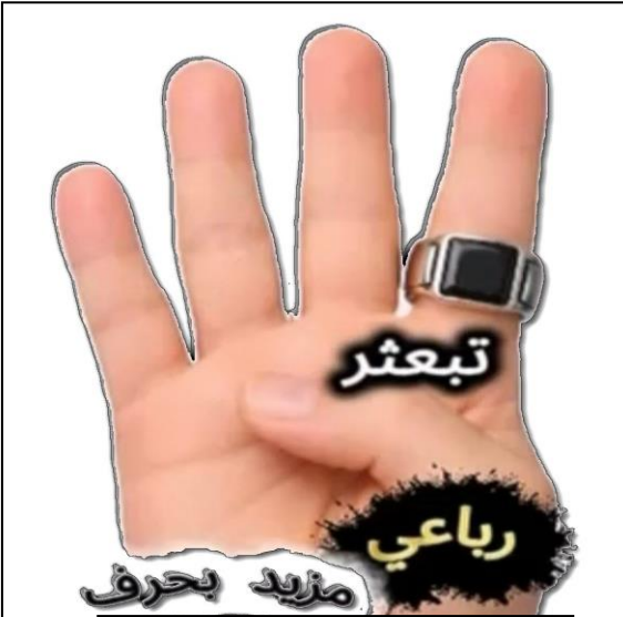
مزيد رباعي بحرف (التاء)