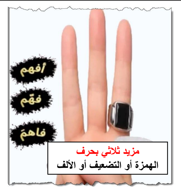
مزيد ثلاثي بحرف الهمزة أو التضعيف أو الألف