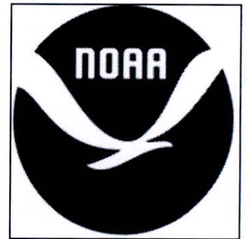
١- الإدارة البحرية و الجوية الأمريكية ص ١٢٤