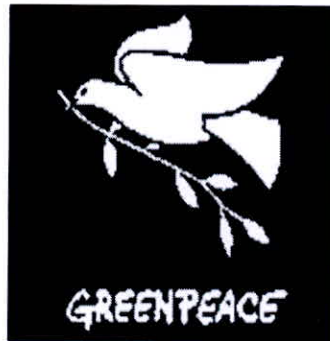
٢- حركة السلام الأخضر. ص ١٢٥