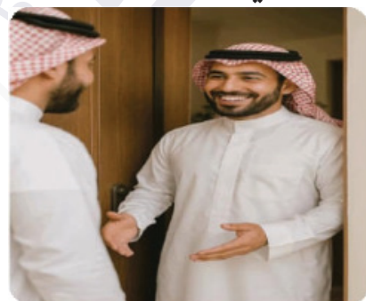
استقبال الضيف بفرحة