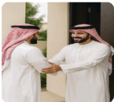
توديع الضيف بالدعاء

اكتب الوصف المناسب الذي يعبر عن أدب من آداب الضيافة في كل صورة مما يأتي :