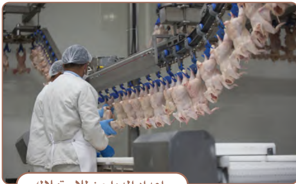
إعداد الدواجن للاستهلاك