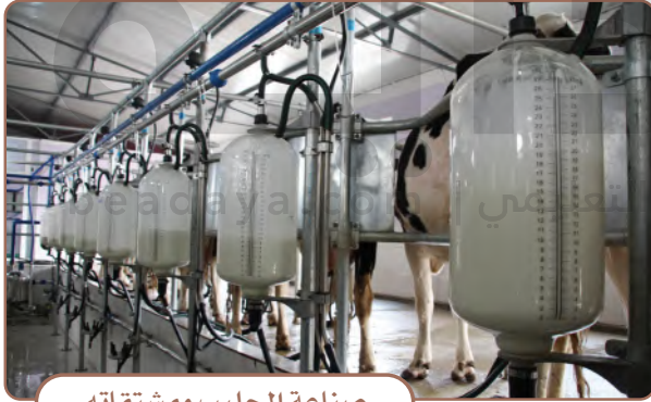
صناعة الحليب ومشتقاته

وفي وطني طرائق حديثة للعناية بالثروة الحيوانية، حيث أنشئت مزارع للدواجن والمواشي، وفي وطني أكبر مزارع للأبقار في العالم، وهي معدّة لإنتاج الحليب ومشتقاته.