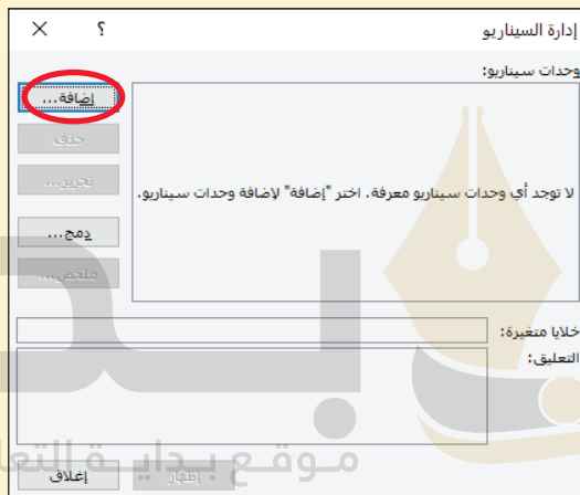
الشكل "10-13": انقر على زر الإضافة لإضافة سيناريو

أدخل "متفائل" في مربع اسم السيناريو، ثم أدخل نطاق الخلايا المتغيرة. لاحظ الخلايا المظللة باللون الأصفر في الشكل "11-13". وكما ترى، إن الخلايا المتغيرة غير متجاورة، لذا أدخل النطاقين مفصولين باستخدام فاصلة (كما هو موضح في الشكل "12-13").