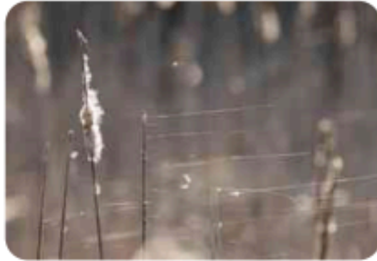
خَيْوِطُ الْعَنْكَبُوتِ الرَّقِيقَةُ

مِنَ الْمُثِيرِ لِلِاسْتِعْرَابِ أَنَّ الْعَنَّاكِبَ لَا تَلْتَصِقُ بِالشَّبَاكِ الَّتِي تَصْنَعُهَا لِفَرَائِسِهَا، وَيَعُودُ ذَلِكَ إِلَى أَنَّ أَطْرَافَهَا الَّتِي تُحِيطُ بِهَا شَعِيرَاتٌ هِيَ الَّتِي تَمْنَعُ التَّصَاقُفَ بِتِلْكَ الْخَيْوِطِ الْحَرِيرِيَّةِ، إِنَّ هَذِهِ الْخَيْوِطَ تُعَدُّ مِنْ أَكْثَرِ الْمَوَادِّ الطَّبِيعِيَّةِ إِثَارَةً لِلدَّهْشَةِ، فَعَلَى الرَّغْمِ مِنْ أَنَّكَ تَرَاهَا خَفِيفَةً سَهْلَةً الْقَطْعِ وَالتَّمْزِيقِ بِحَرَكَةٍ مِنْ إصْبَعِكَ الصَّغِيرِ، إِلَّا أَنَّكَ سَتَعْجَبُ حِينَ تَعْرِفُ عَنْ خَصَائِصِهَا الَّتِي تُمَيِّزُهَا، وَالَّتِي تَجْعَلُهَا مَادَّةً