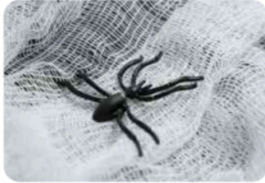
الضَّمَادَةُ الْعَنْكَبُوتِيَّةُ: مِنْ أَهَمِّ اسْتِخْدَامَاتِ خَيْوِطِ الْعَنْكَبُوتِ

لَمْ تَكُنِ الْعَنَّاكِبُ يَوْمًا مِثْلَ بَقِيَّةِ الْحَشَرَاتِ، إِذْ إِنَّهَا تَصْنَعُ بُيُوتَهَا مِنَ الْخُيُوطِ الَّتِي تَغْزِلُهَا مِنْ أَسْفَلِ بَطْنِهَا، وَلِتَكُونَ شِبَاكَاً مُحْكَمَةً فَتَقَعُ فِيهَا بَقِيَّةُ الْحَشَرَاتِ، وَقَدْ يَكُونُ