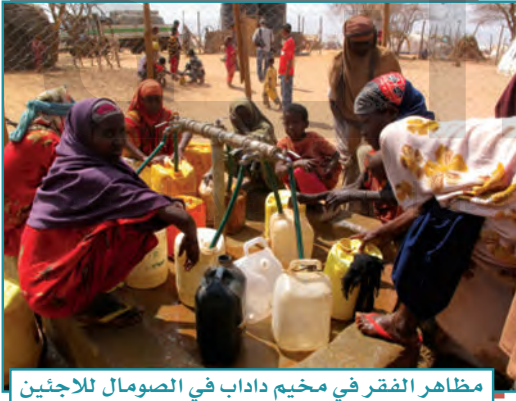
مظاهر الفقر في مخيم داداب في الصومال للاجئين