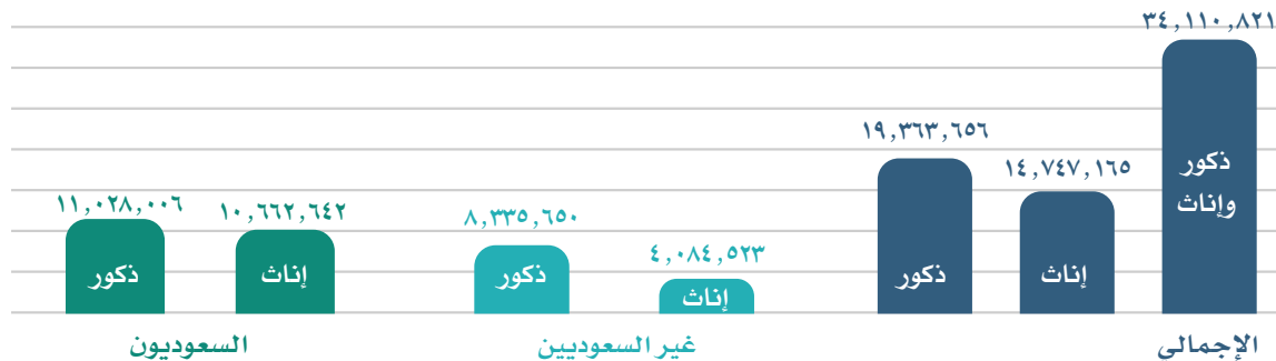
سكان المملكة العربية السعودية حسب تقديرات عام ١٤٤٢هـ