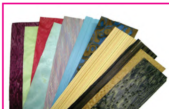
الشكل (٩٠): قشرة صناعية بألوان مختلفة

كما توجد القشرة الصناعية التي تصنع من مخلفات الأخشاب ويتم تسوية أسطحها بتأثيرات فنية وصباغتها بالألوان الصناعية المتعددة الشكل (٩٠)