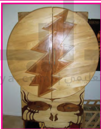
الشكل (١٠١): مجسم مطعم بالقشرة الخشبية