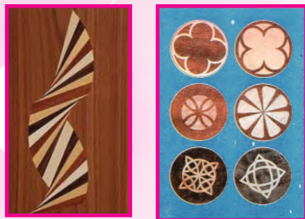
الشكل (٩٢): وحدات هندسية بالقشرة « الباركتري »