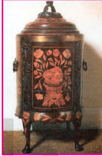
الشكل (٨٨): زخارف نباتية بالقشرة الخشبية لقطعة أثاث بألمانيا (في أواخر القرن ١٧م)

وقد تأثرت الفنون الأوروبية بعد ذلك بأساليب الزخرفة الإسلامية لتزيين الخزائن وقطع الأثاث بالقشرة الخشبية، الشكل (٨٨).