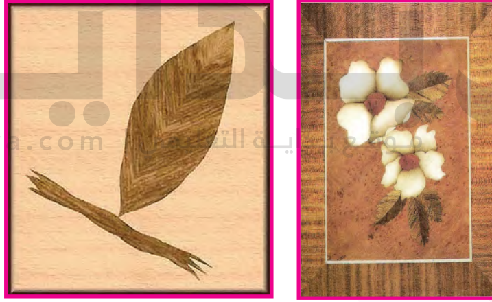
الشكل (٩١): تصميمات نباتية بالقشرة الخشبية « الماركتري »

وهو أسلوب خاص لتشكيل القشرات الخشبية في صورة حشوات بتصميمات لوحات زخرفية إسلامية نباتية وحلزونية أو كتابات خطية مفرغة الشكل (٩١).