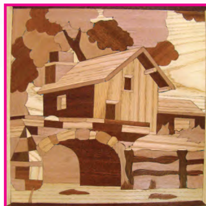
الشكل (٩٨): عمل الطالبة: حنين ملايو