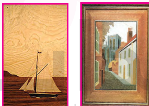
الشكل (٩٣): مناظر طبيعية بالقشرة « انتراشيا »

وهي كلمة إيطالية معناها تطعيم المناظر الطبيعية والأماكن الأثرية لإعطاء جو فني يشبه المناظر التصويرية، الشكل (٩٣).