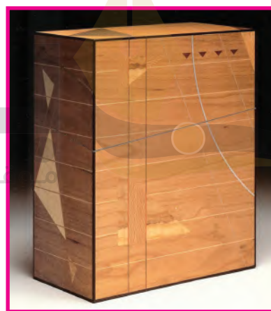
الشكل (١٠٠): صندوق بالقشرة الخشبية