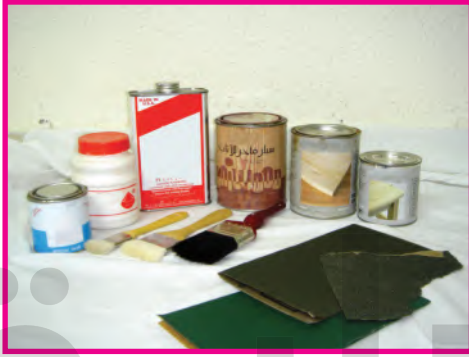
الشكل (٩٦): أدوات التشطيب النهائي

قبل البدء بالعمل لا بد من تجهيز الأدوات والخامات اللازمة ويمكن الحصول عليها من المحلات الخاصة بالأسواق المحلية أو المكتبات وهي موضحة في الشكلين (٩٥-٩٦).