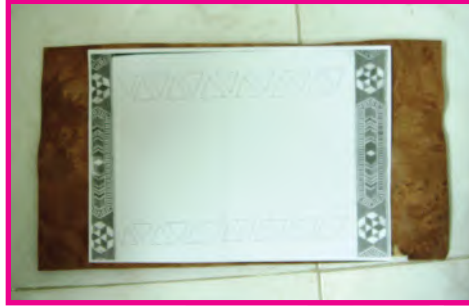
الشكل (٩٧-أ): إعداد التصميم وتثبيته