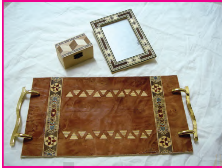
الشكل (٩٧): عمل: إيمان حلواني