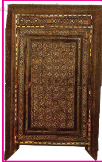
الشكل (٨٧): لوح خشبي مفصل ومطعم بالعاج

تعد الأخشاب الطبيعية المصدر الرئيس للحصول على الأخشاب الصناعية والقشرة الخشبية التي استخرجت منذ القدم، وازدهرت باستخداماتها المتعددة في العصر الإسلامي حتى أصبحت ميداناً لتجميل الأسطح الخشبية في كثير من الأقطار الإسلامية، منذ بداية عصر المماليك الذي عاصر نهضة فنية رائعة في منتجات الأخشاب للأثاث والأبواب والعلب وحوامل المصاحف وغيرها. وكان لنواهي الدين الإسلامي أثر على تقوية وازدهار الزخرفة الهندسية والنباتية والكتابية والآيات القرآنية بتشكيلها على أسطح الأعمال الخشبية عن طريق فن التطعيم بالصدف والعاج والقشرة الخشبية، الشكل (٨٧).