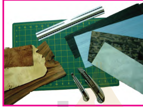
الشكل (٩٥): خامات وأدوات التشكيل