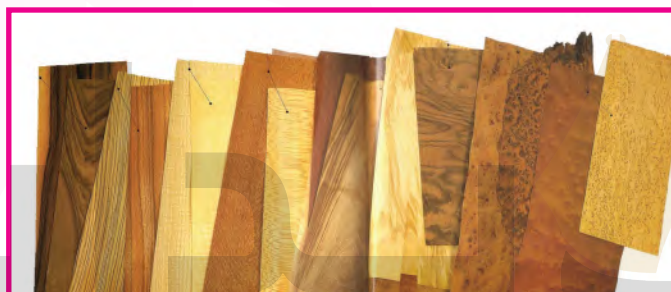
الشكل (٨٩): قشرة طبيعية بدرجاتها اللونية المتعددة

تعددت أنواع القشرة الخشبية نظراً لتعدد أنواع الأخشاب المستخرجة منها، فهناك قشرة الأخشاب الطبيعية : كالبلوط، والماهوجني، والزان وغير ذلك. الشكل (٨٩)، ومن هذه الأشجار المنتجة للقشرة ما هو داكن اللون، ومنها ما هو فاتح اللون.