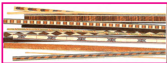
الشكل (٩٤): فلتات خشبية مختلفة الألوان والزخارف

وهي عبارة عن أشرطة ذات سمك رقيق من القشرة الخشبية وتستخدم في حصر حشوات الماركترى والباركتري وغيرها من أشغال القشرة، الشكل (٩٤).