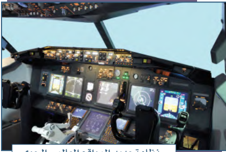
نظام تحديد المواقع العالمي الجوي