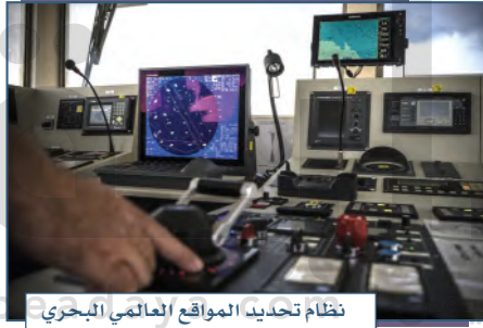
نظام تحديد المواقع العالمي البحري

ويعمل هذا النظام بأن ترسل الأقمار الصناعية إشارات تلتقطها محطات المتابعة الأرضية؛ لتحديد موقع القمر، ومقدار بعده عن المحطة، ثم تعيد هذه المعلومات للقمر الصناعي الذي يبثها مرة أخرى؛ لتستقبلها أجهزة استقبال مخصصة، يظهر على شاشاتها الموقعُ الإحداثي لها، والارتفاعُ عن سطح البحر، وسرعةُ حركة المستخدم، إضافةً إلى وجود سهم يشير إلى جهة المكان المراد الوصول إليه.