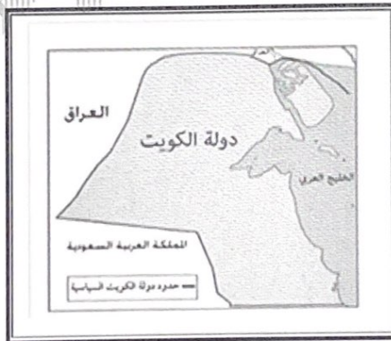
● خريطة دولة الكويت السياسية ص ١٧٦