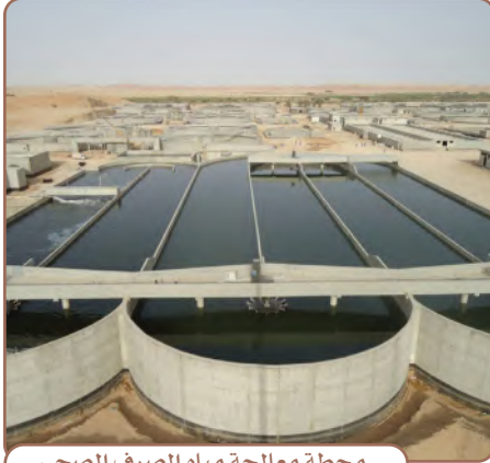
محطة معالجة مياه الصرف الصحي

هي مورد جديد يدعم موارد المياه الأخرى، ولقلَّة المياه الجوفية والسطحية في المملكة العربية السعودية، جاء التفكير في كيفية الاستفادة من مياه الصرف الصحي بعد معالجتها؛ لاستعمالها في بعض المجالات، منها: ريّ الحدائق والمتنزهات ، وبعض الأغراض الصناعية .