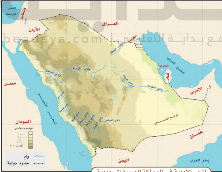
أشهر الأودية في المملكة العربية السعودية