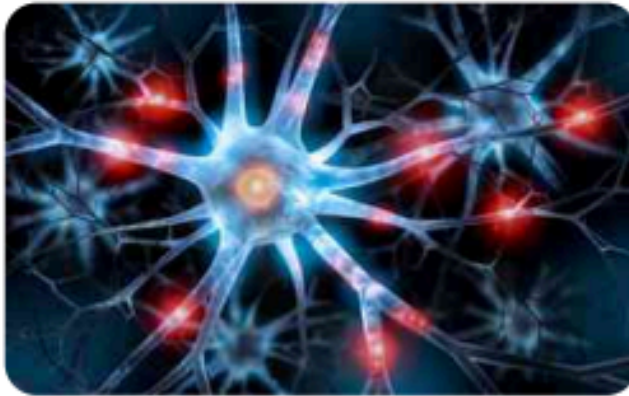
شكل الخلية العصبية

يفعل معظمنا كلّ ما في وسعِهِ لِتجنّب الألم، معتقدين أنّ الحياة الخالية مِنْهُ هي حياة سعيدة. وللتخفيف مِنْهُ أو إزالته يستهلك البشر كلّ يوم حوالي 14 مليار جرعة مِنْ مسكّنات الألم، ولكن.. عندما نعرف ماهيّة الألم الحقيقية نتيقّن أنّ الحياة مِنْ دون ألم ستكونُ بحدّ ذاتها هي أقصى ما يُمكن أن يُؤلّم.