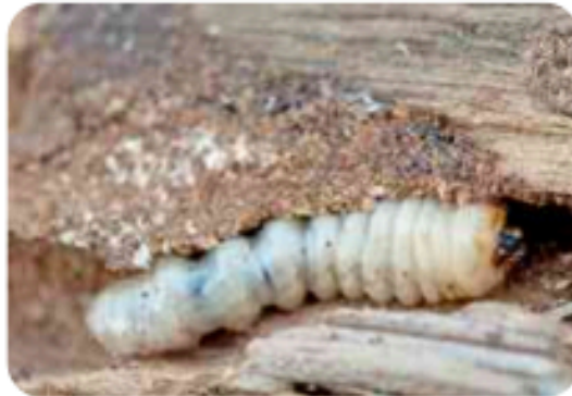
يرقة سوس الخشب

من الخشب المصاب إلى الخشب السليم، وهو لا يسبب الأذى أو الأمراض للبشر، لكنه يسبب خسائر مادية كبيرة بسبب تلف الأخشاب وتدميرها. غالباً يظهر سوس الخشب في المنزل بسبب انتقال السوس من الخشب المصاب إلى السليم، لأسباب منها: شراء قطعة أثاث مصابة بالسوس، كما تعد الرطوبة من أكثر الأشياء التي تجذب سوس الخشب إلى المنزل.