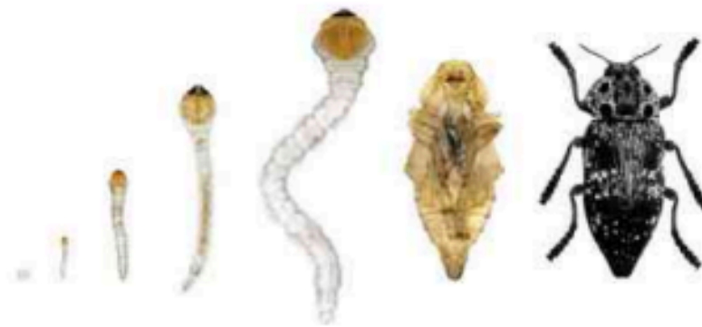
دورة حياة سوسة الخشب

توجد أنواع من الحشرات التي تُصيبُ الخشبَ، وتُسببُ بمرور الوقت تلفه، ولكنها تختلف عن بعضها في طريقة الإتلاف، وحشرة سوس الخشب هي إحدى هذه الحشرات الصغيرة التي تبدأ دورة حياتها بمرحلة