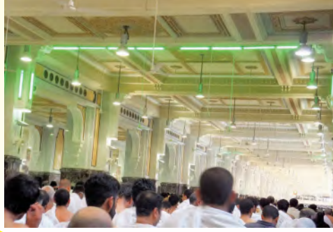
حدود العلمين الأخضرين

٢ ثم ينزل متجهاً إلى المروة، فيمشي حتى يُحاذي الأعمدة والأنوار الخضراء على جانبي المسعى، فإذا حاذها استُحِب للرجل فقط أن يسعى سعياً شديداً حتى يصل إلى الأعمدة والأنوار الخضراء التي تليها، ثم يكمل مشيه إلى المروة.