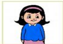
أنتِ فتاة رائعة