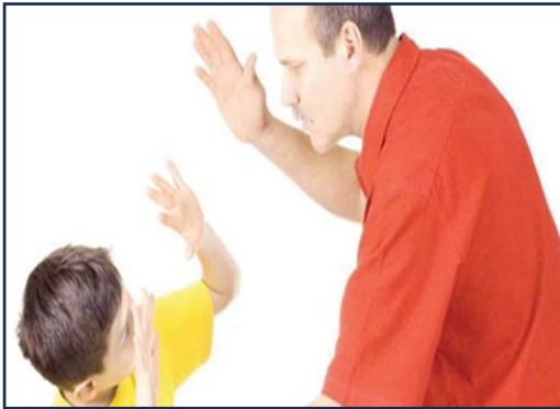
العنف ضد الأطفال