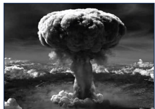
انفجار قنبلة هيروشيما - نجازاكي ) في اليابان