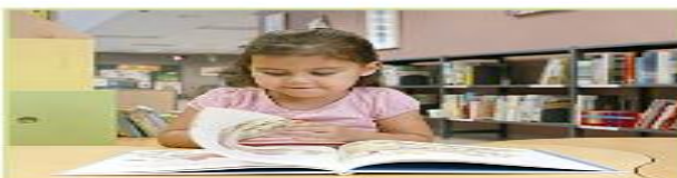
هي تقرأ القصة