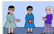
أنتن معلمات نشيطات