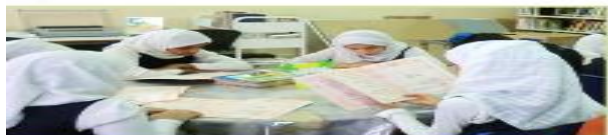
هن يقرأن القصص

2. أعبّر عن الصور الآتية بجملة مفيدة باستخدام ضمائر الغائب ( هو . هي . هم . هن ) :