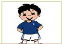
أنتَ طفل جميل

3. أكمل الجمل الآتية بضمير خطاب مناسب ( أنت . أنتَ أنتما . أنتم . أنتن ) يعبر عن الصورة: