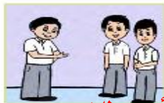
أنتم طلاب مجتهدون