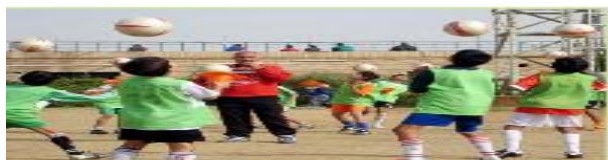
هم يلعبون بالكرة