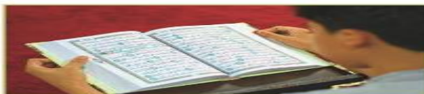
هو يقرأ القرآن