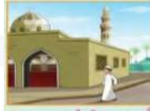
الذهاب مبكراً إلى المسجد