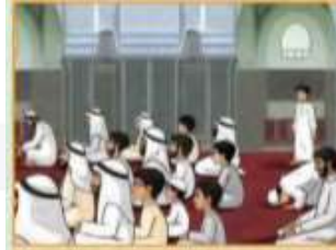
لا يتخطى أحداً ويجلس حيث وجد مكاناً