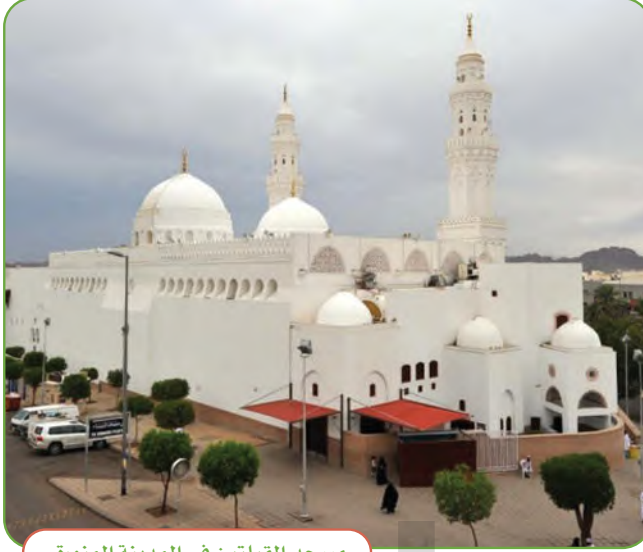
مسجد القبلتين في المدينة المنورة