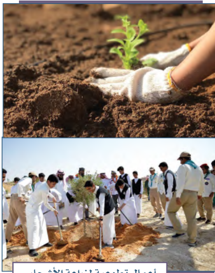
أعمال تطوعية لزراعة الأشجار