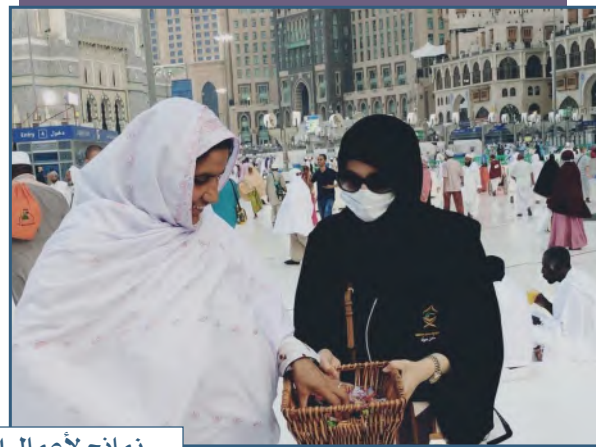
نماذج لأعمال التطوع في مكة المكرمة