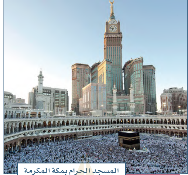
المسجد الحرام بمكة المكرمة