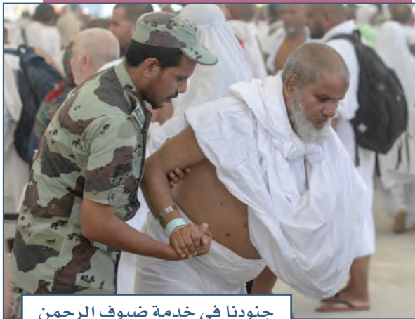
جنودنا في خدمة ضيوف الرحمن

الأمن الوطني في المملكة العربية السعودية يشمل الجانب الداخلي، وأي مهددات من الجانب الخارجي، فوطننا مستهدف من الأعداء، ولهذا يجب علينا حمايته من الداخل والخارج.