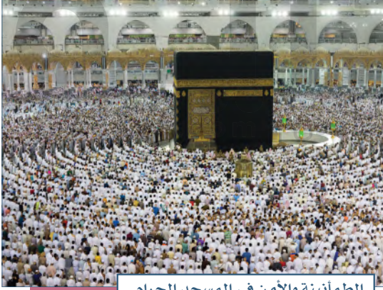
الطمأنينة والأمن في المسجد الحرام

الأمن الوطني هو الخطط والإجراءات والأعمال التي تتخذها الدولة لتحقيق الاستقرار السياسي والاقتصادي والاجتماعي لأفراد المجتمع ومؤسساته وأراضي الوطن، وللدفاع عن مصالحها الحيوية الداخلية والخارجية من أي عدوان خارجي، أو تهديد داخلي. تتبع دولتنا سياسة متوازنة تمنع التفرق، وتحث على الوحدة، وقوة الولاء للوطن والقيادة على أسس الإسلام.