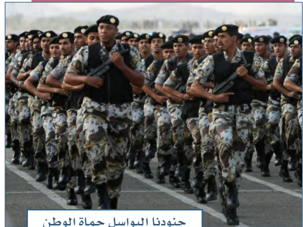
جنودنا البواسل حماة الوطن