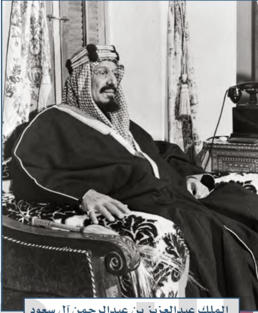
الملك عبدالعزيز بن عبدالرحمن آل سعود

وتُعَدُّ مدن وطننا المملكة العربية السعودية أكثر مدن العالم أمناً، إذ تتقلص فيها نسب الجريمة والمخدرات، وذلك بسبب وعي مجتمعنا وتعاونه مع سلطات الدولة. ومنذ أن وُحِدَ الملك عبدالعزيز - طيب الله ثراه - كيان هذه البلاد إلى يومنا هذا بقيادة خادم الحرمين الشريفين الملك سلمان بن عبدالعزيز آل سعود وولي عهده صاحب السمو الملكي الأمير محمد بن سلمان بن عبدالعزيز آل سعود - وفقهم الله جميعاً - يعيش بلدنا بأمن وطمأنينة.