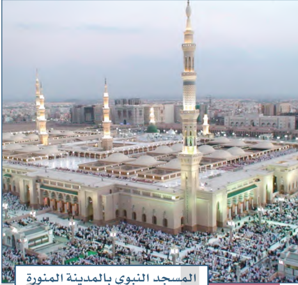
المسجد النبوي بالمدينة المنورة