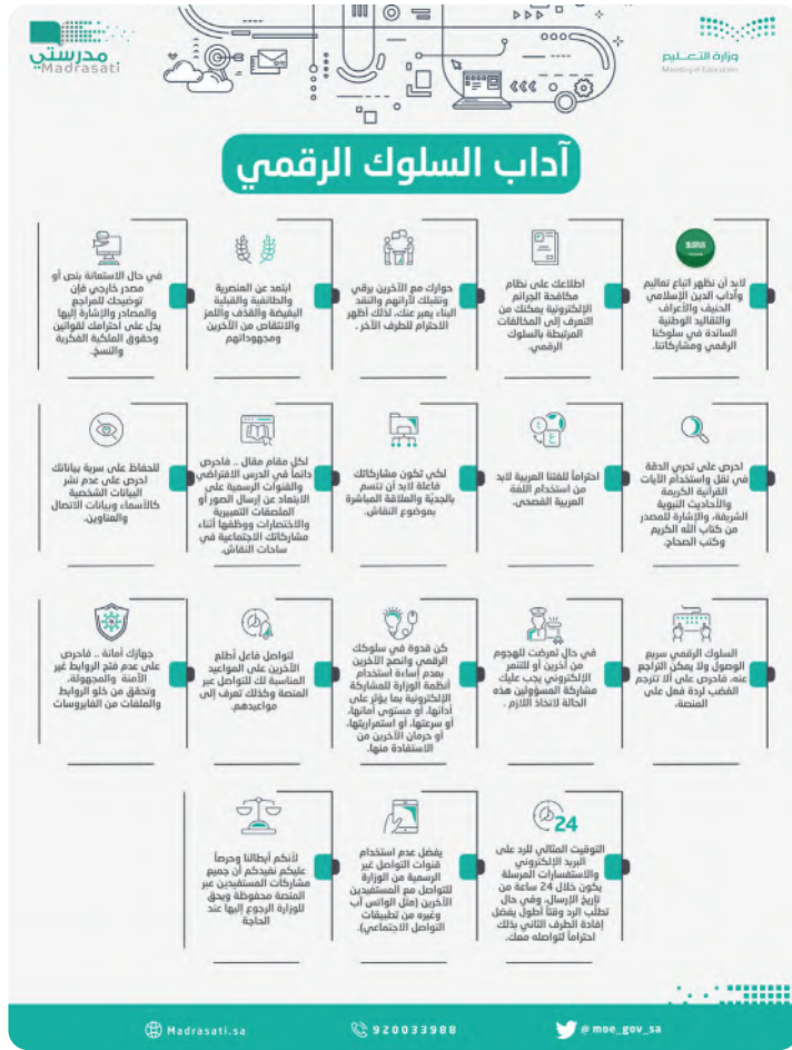
شكل (2-9): آداب السلوك الرقمي لمنصة مدرستي