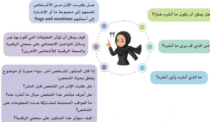
شكل (6-2): طرائق حماية السمعة الرقمية

قبل أن تشارك أي منشور عبر شبكة الإنترنت، اسأل نفسك الأسئلة الموضحة بالشكل (6-2):