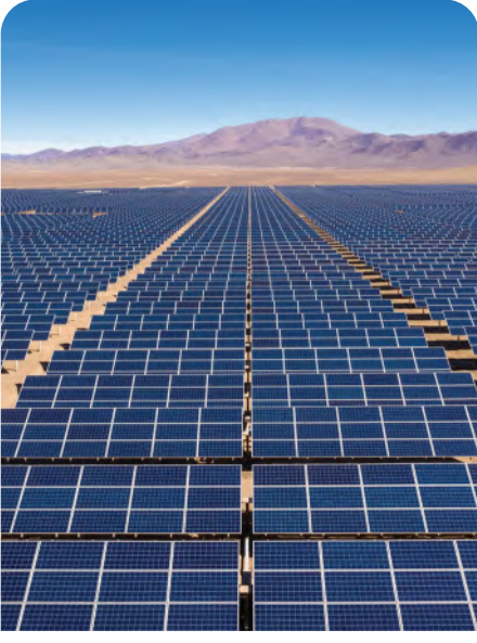
الشكل 9-5 ألواح الطاقة الشمسية.