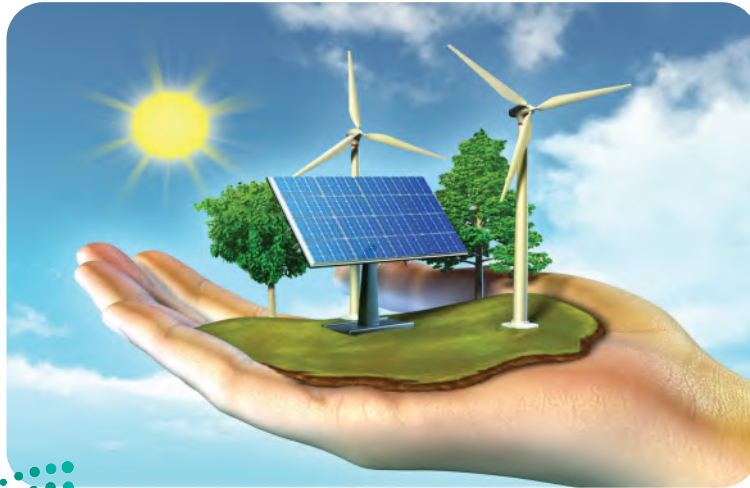
شكل 5-8 الطاقة المتجددة.