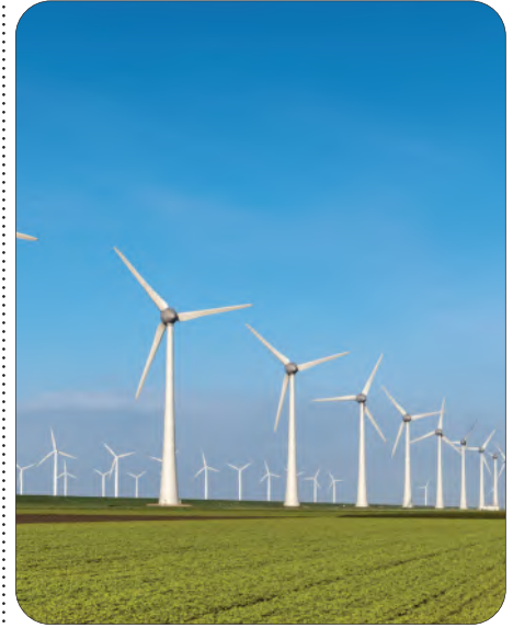
الشكل 11-5 طاقة الرياح.

وهي الطاقة الناتجة من حركة الرياح. والتي يتم من خلالها تحويل الطاقة الحركية إلى طاقة كهربائية وذلك عن طريق التوربينات الهوائية (مبدأ تحويل الطاقة)، ويعتمد في تحديد مواقع حقول الرياح بشكل كبير على دراسة نشاط حركة الرياح في المنطقة، ويتم قياس ذلك عن طريق الدراسات الجيوغرافية والأقمار الصناعية وأجهزة الرصد والقياس الاستشعارية الشكل 11-5.