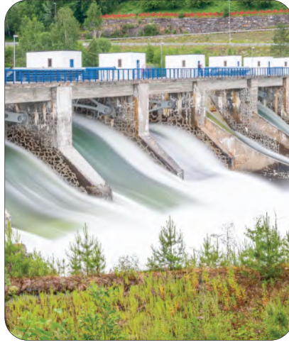
الشكل 13-5 طاقة المياه الجارية أو الساقطة.