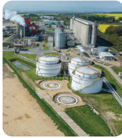
الشكل 14-5 الطاقة الحيوية.

وكما ذكر سابقاً يعد مشروع محطة دوامة الجندل لإنتاج طاقة الرياح الأول من نوعه على مستوى المملكة العربية السعودية والأكبر على مستوى منطقة الشرق الأوسط، وتبلغ طاقته الإنتاجية 400 ميغا واط.