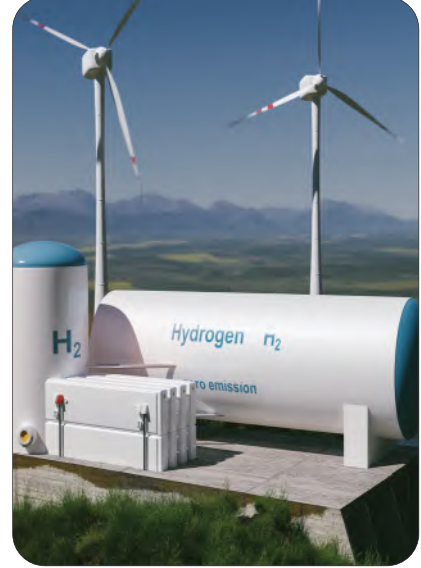
الشكل 15-5 طاقة الهيدروجين.

للطاقة أشكال متعددة ويمكن للطاقة أن تتحول من شكل لآخر. مثل تحول الطاقة الشمسية إلى طاقة كهربائية.