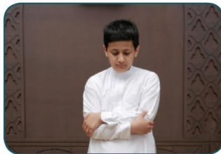
موضع اليدين خطأ