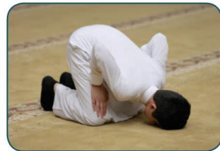
موضع اليدين خطأ