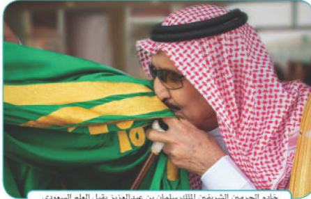
خادم الحرمين الشريفين الملك سلمان بن عبدالعزيز يقبل العلم السعودي

توحدت أراضي وطني المملكة العربية السعودية في دولة واحدة، تحكمها الأسرة المالكة (آل سعود)، ويشترك في بنائها جميع المواطنين. وطني يتكون اليوم من ١٣ منطقة.