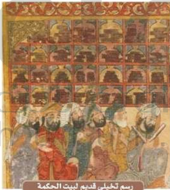
رسم تخيلي قديم لبيت الحكمة

أنّ الخليفة العباسي المأمون عندما دخل قبرص، طلب من أهلها ألا تؤخذ منهم الجزية (أموال تؤخذ مقابل الحماية) إذا هم أرسلوا له كتبهم في العلوم. وقد أمر بترجمتها، واستفاد منها المسلمون وزادوا عليها وأبدعوا.