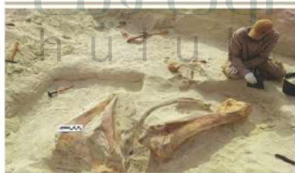
استخراج عظام الكتف والمضد لأحد الفيلة المنقرضة في رواسب البحيرات القديمة في صحراء النفود

◆ في هذه الرمال كثير من المعادن النفيسة، والآثار القديمة المطمورة، إضافة إلى بعض الواحات والأشكال الجاذبة للسياحة.