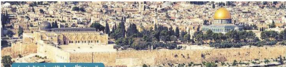
المسجد الأقصى في القدس (بيت المقدس)