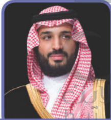
صاحب السمو الملكي (ولي العهد)

التواضع الذي يعيشه الملك وولي عهده حفظهما الله مع المواطنين