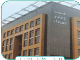
المجلس الأعلى للقضاء