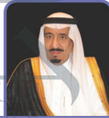
خادم الحرمين الشريفين (الملك)