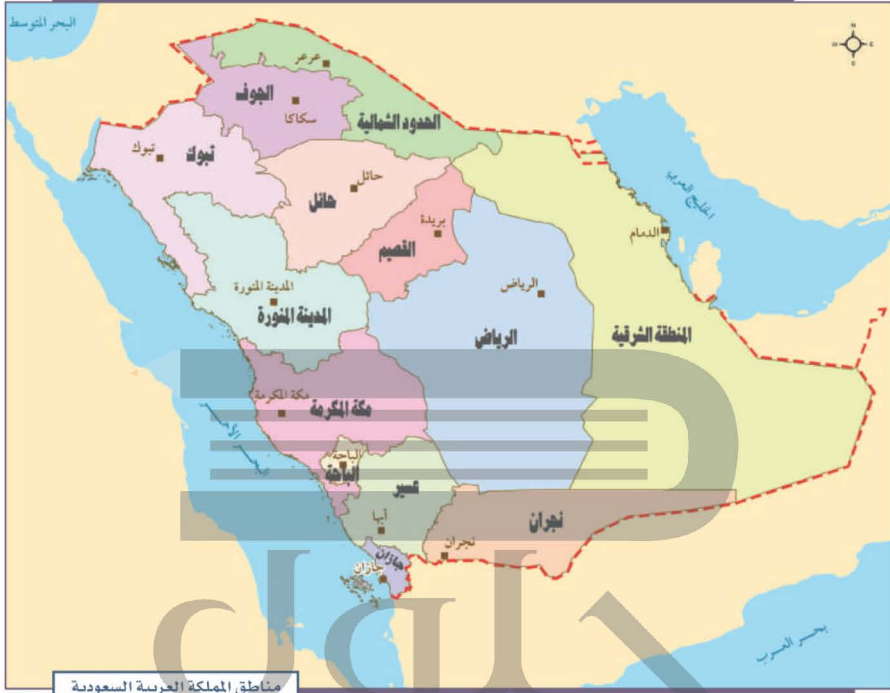
مناطق المملكة العربية السعودية