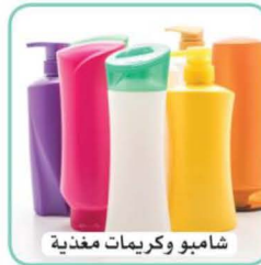
شامبو وكريمات مغذية