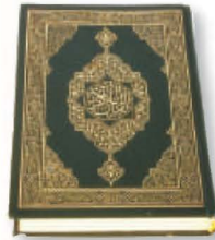
١ القرآن الكريم

نستمدُّ الأحكامَ الشرعيةَ من مصدرين عظيمين هما: