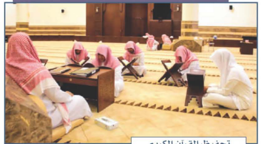
تحفيظ القرآن الكريم