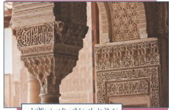
زخرفة على اعمدة قصر الحمراء بالأندلس