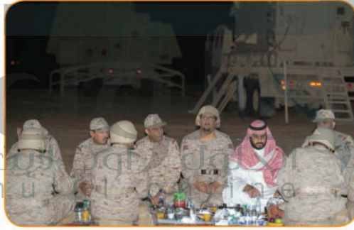
جنود مرابطون يتناولون الإفطار في شهر رمضان المبارك مع صاحب السمو الملكي ولي العهد الأمير محمد بن سلمان حفظه الله.