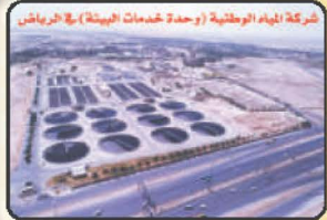
شركة المياه الوطنية (وحدة خدمات البيئة) - الرياض