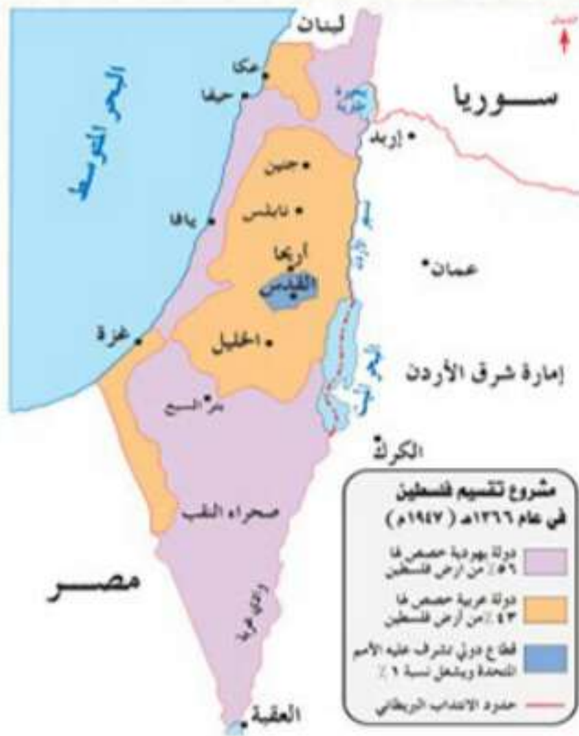
مشروع تقسيم فلسطين