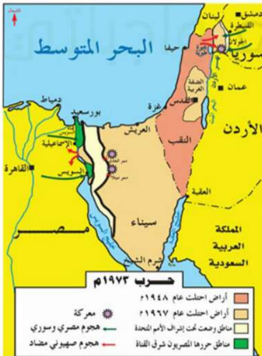
▲ حرب ١٩٧٣م

الحربي في مصر وسوريا، أصدر مجلس الأمن قراراً بإيقاف الحرب وبدء المحادثات للوصول إلى حلول سلمية. ومن نتائج هذه الحرب ارتفاع الروح المعنوية العربية، وظهور أهمية التنسيق العربي، وكسب تأييد الدول الإفريقية ودول عدم الانحياز.