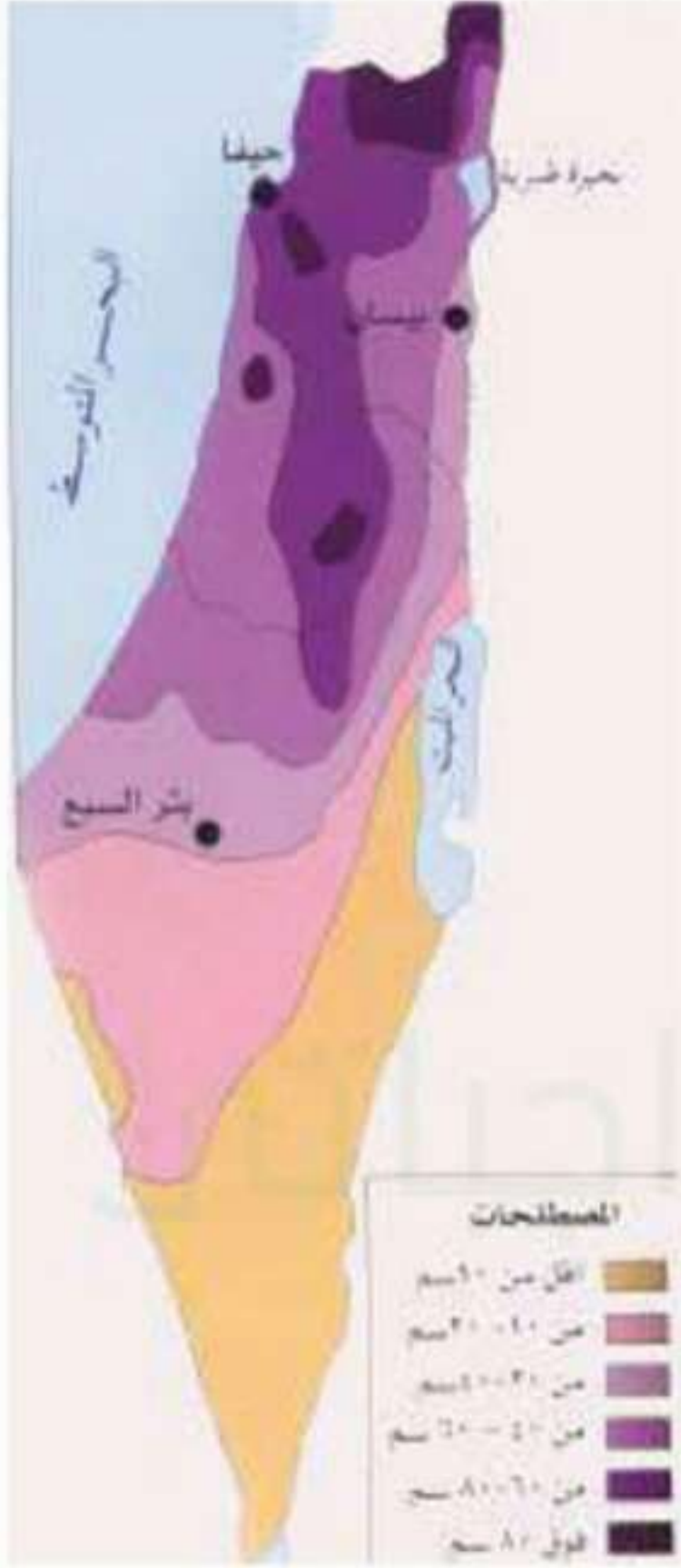
توزيع الأمطار في فلسطين