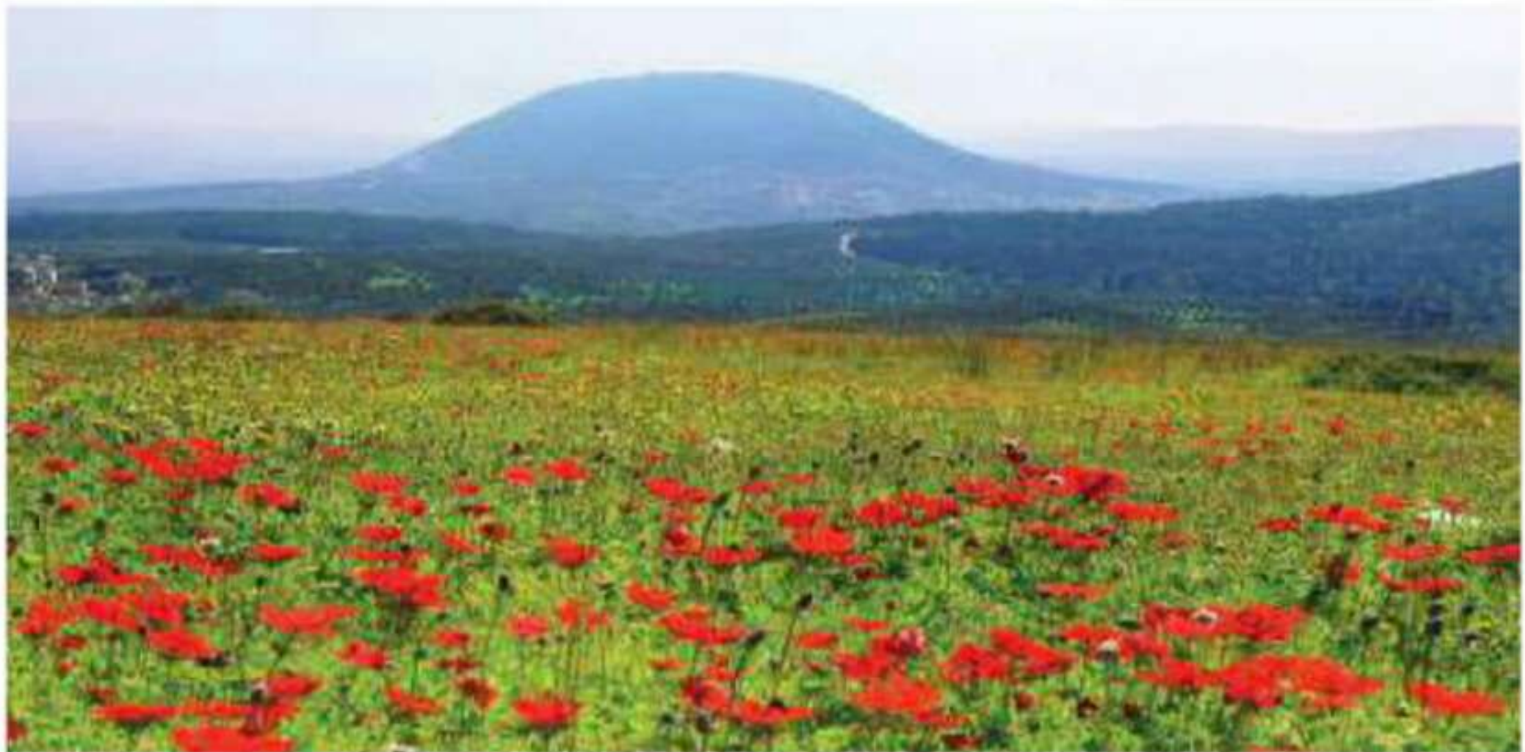
▲ جمال الطبيعة في فلسطين

يسود المناخ شبه الصحراوي في منطقة الأغوار أخفض منطقة في العالم، التي ترتفع درجة الحرارة بها صيفاً، فتصل القصوى إلى 49^{\circ}\text{C} في أشهر الصيف، وتكون دافئة شتاءً ( 15 - 20^{\circ}\text{C} ) وهو ما يجعلها منطقة استجمام شتوية، وتسقط الأمطار شتاءً. وتحجز سلسلة الجبال في وسط الضفة الرياح الغربية المحملة بالأمطار من الوصول إلى هذه المنطقة، ويكون معدلها في الشمال أكبر منه في الجنوب، لذلك لا يتعدى معدل سقوط المطر على شاطئ البحر الميت 100 ملم.