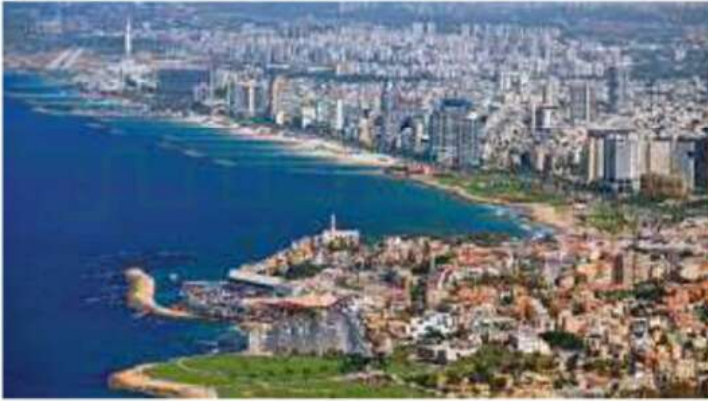
صورة جوية لمدينة يافا بفلسطين

الإضراب العام في جميع أنحاء فلسطين واستمر ستة أشهر احتجاجاً على الهجرة اليهودية لفلسطين، ثم تشكلت لجنة تسمى (اللجنة العربية العليا)، وأصدرت مجموعة من القرارات في أول بيان لها، حددت فيه أربعة مطالب رئيسية، هي: ١- العدول عن فكرة الوطن القومي اليهودي الناشئة عن وعد بلفور.