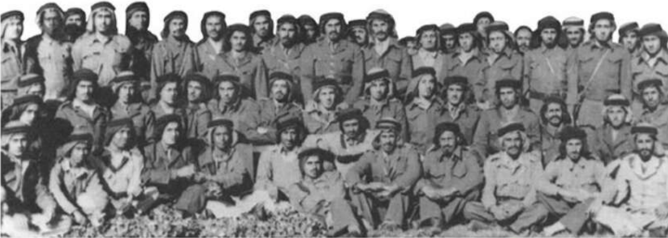
▲ مجموعة من الجنود السعوديين الذين شاركوا في حرب فلسطين عام ١٣٦٧هـ / ١٩٤٨م