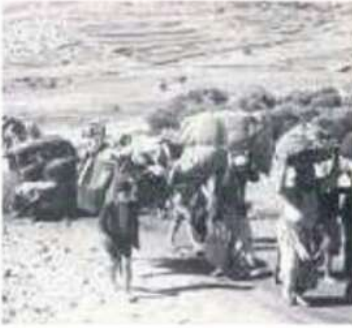
▲ فلسطينيون نازحون عن ديارهم بعد الحرب