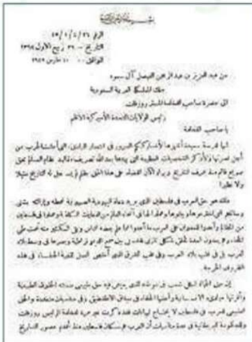
صورة للصفحة الأولى لرسالة الملك عبد العزيز للرئيس الأمريكي (فرانكلين روزفلت)

لكن بريطانيا تراجعت عن وعدها للعرب بعد الحرب العالمية الثانية وأعلنت الحكومة البريطانية تراجعها عن الكتاب الأبيض عام ١٣٦٤هـ / ١٩٤٥م.