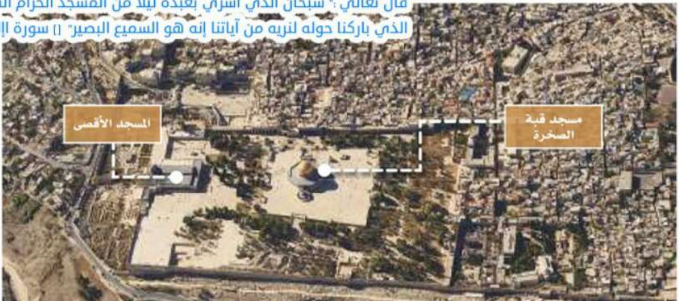
المسجد الأقصى يشمل كل ما هو داخل في السور

الإسراء : هو الرحلة الارضية التي هياها الله لرسوله صلى الله عليه وسلم من مكة الى القدس من المسجد الحرام الي المسجد الاقصى، رحلة أرضية ليلية والمعراج : رحلة من الارض الى السماء، من القدس إلى السماوات . العلاء الي مستوى لم يصل إليه بشر من قبل، إلى سدرة المنتهي، إلى حيث يعلم الله قال تعالى: " سبحان الذي أسرى بعبده ليلا من المسجد الحرام الي المسجد الاقصى الذي باركنا حوله لنريه من آياتنا إنه هو السميع البصير" [ سورة الإسراء : آية 1