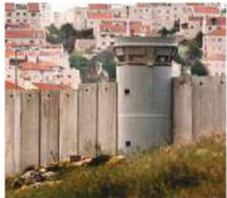
▲ إنشاء مستوطنات اليهود المحتلين في فلسطين