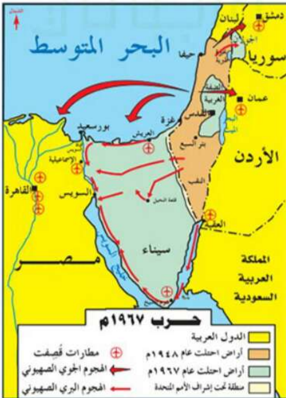
▲ حرب النكسة الكبرى

وصارت النسبة المتبقية للعرب من فلسطين (٢٣٪). كما احتل العدو الصهيوني شبه جزيرة سيناء المصرية، ومرتفعات الجولان السورية.