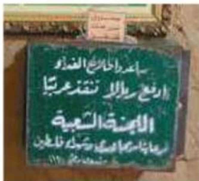
مستودق تبرعات فلسطين

وجانب مهم أيضاً هو الجانب الشعبي، حيث هبّ المواطنون السعوديون إلى التبرع بأموالهم وممتلكاتهم لدعم فلسطين. وتشهد قوائم الدعم الوطني في المجتمع السعودي المنشورة على صفحات جريدة أم القرى على ذلك.