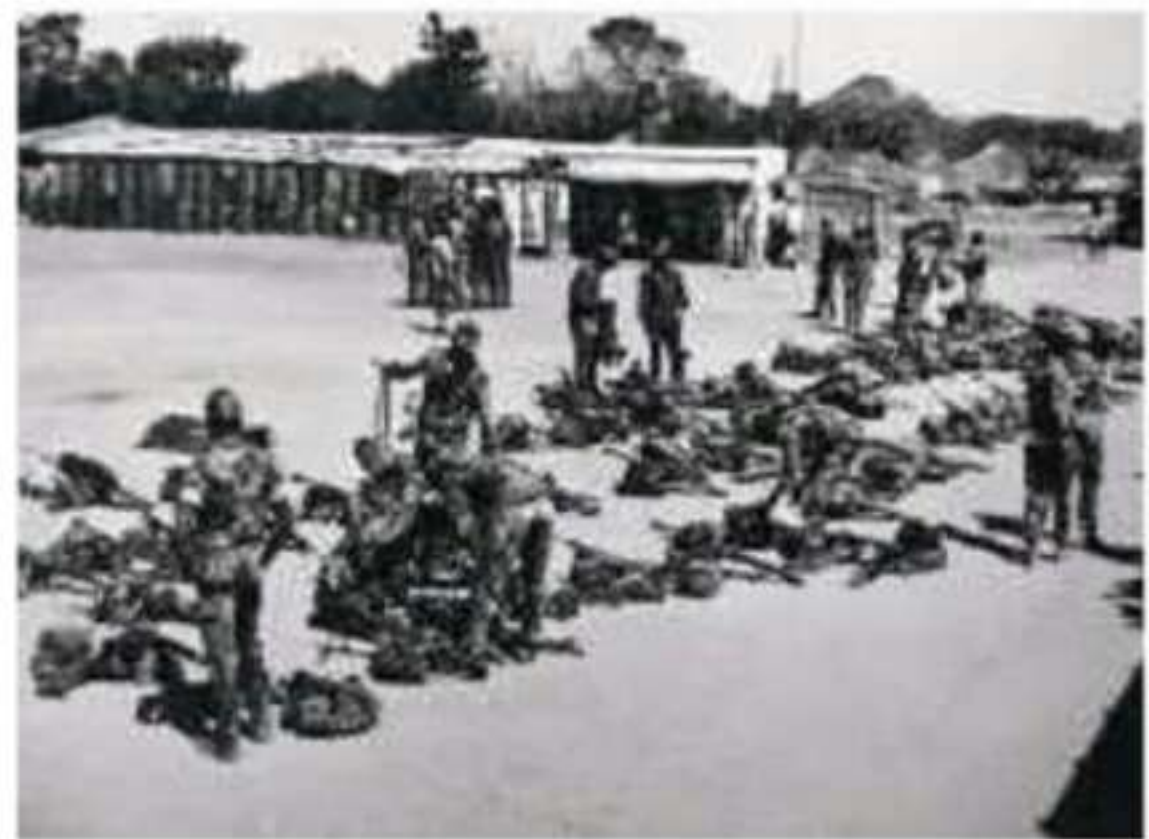
▲ صورة من حرب عام ١٩٧٣م