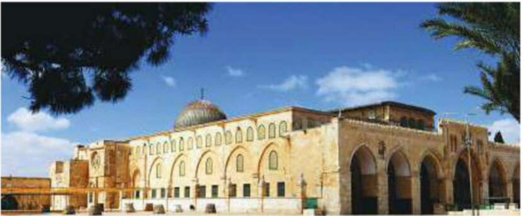
المسجد الأقصى المبارك

وتتخلل هذه المرتفعات السهول والأودية، وأهم المدن فيها: صفد، والناصرية، ونابلس، ورام الله، والقدس، وبيت لحم، والخليل.