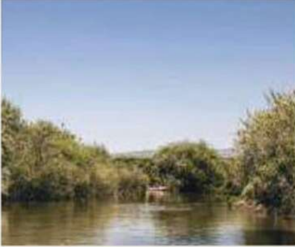
▲ نهر الأردن

يجري نهر الأردن في شمال شرقي فلسطين، ويعد أعظم أنهار فلسطين وأكبرها، وينبع من جبل الشيخ إذ تغذي منابعه ثلاثة أنهار رئيسة هي: بانياس في سورية، والحاصباني في لبنان، والدان في فلسطين. ويجري نهر الأردن من سهل الحولة شمالاً منحدرًا نحو بحيرة طبرية فيصب فيها، ثم يخرج من طرفها الجنوبي، وعندئذ تغذيه روافد متعددة أكبرها نهر اليرموك، ثم يواصل جريانه نحو الجنوب حتى يصب في البحر الميت. ويقدر حجم المياه التي يصبها نهر الأردن في البحر الميت بنحو ١٢٠٠ مليون متر مكعب في العالم.