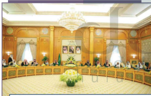
مجلس الوزراء برئاسة خادم الحرمين الشريفين الملك سلمان - يحفظه الله -