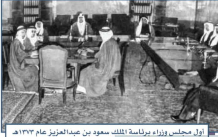
أول مجلس وزراء برئاسة الملك سعود بن عبدالعزيز عام ١٣٧٣هـ