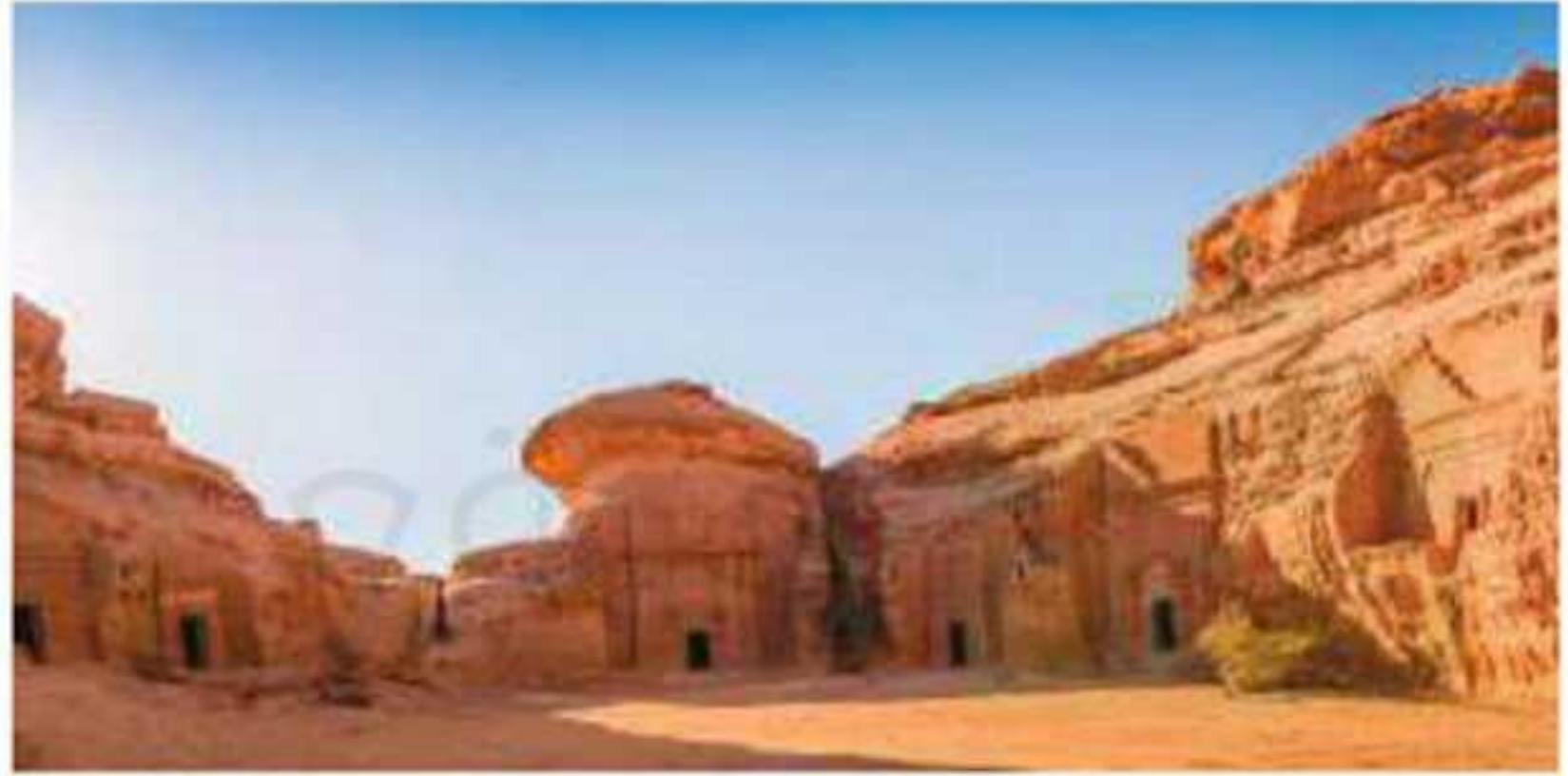
▲ مدائن صالح بالعلا

قامت على أرض المملكة العربية السعودية ممالك وحضارات قديمة، مثل: كندة ودومة الجندل ومدين. كما شهدت مكة المكرمة مبعث خاتم الأنبياء وأشرف المرسلين محمد بن عبدالله ﷺ، وتأسيس الدولة في العهد النبوي وعاصمتها المدينة المنورة، التي نشرت الإسلام في أرجاء الجزيرة العربية، ثم إلى سائر بقاع العالم، وشهدت أيضاً أحداث عهد الخلفاء الراشدين ﷺ.