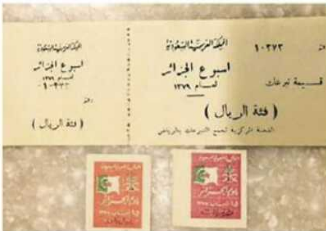
طوابع تعبر عن تلاحم الشعب السعودي والجزائري