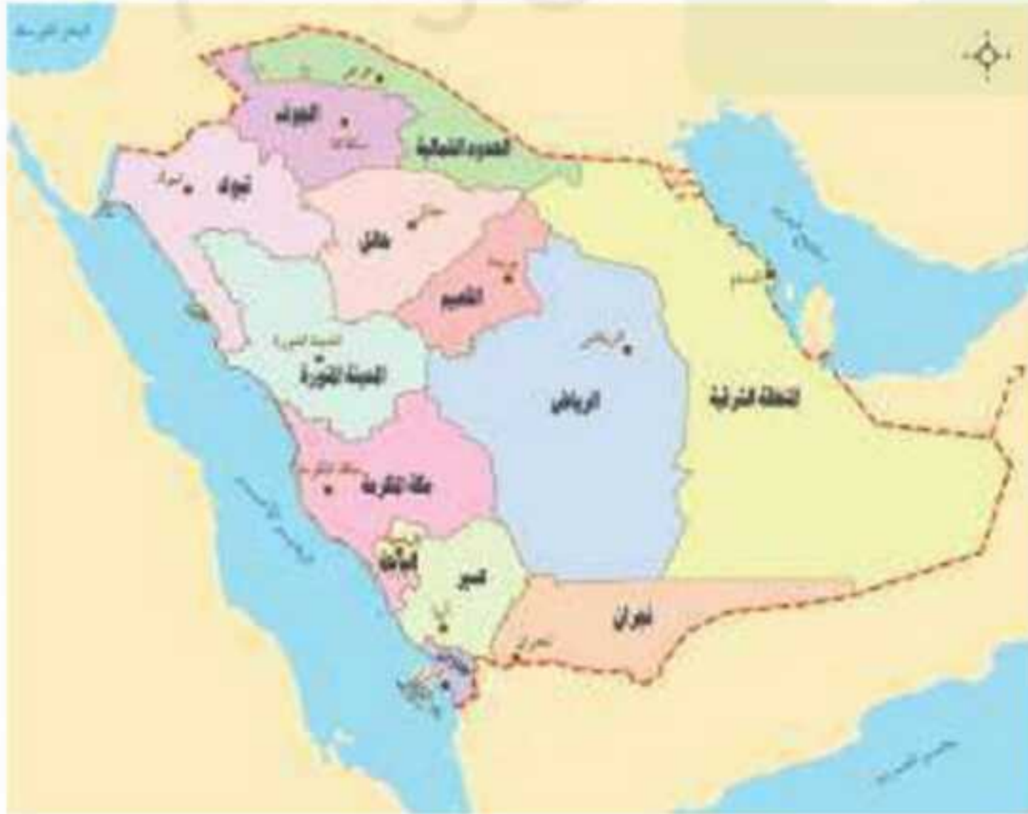
المملكة العربية السعودية

وورد في المادة الخامسة والعشرين من نظام الحكم ما يأتي: «تحرص الدولة على تحقيق آمال الأمتين العربية والإسلامية في التضامن وتوحيد الكلمة وعلى تقوية علاقتها بالدول الصديقة».