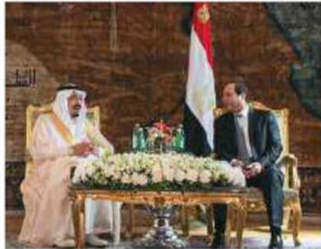
⚠️ لقاء الملك سلمان بن عبدالعزيز بالرئيس المصري ٢٠١٦هـ / ٢٠١٦م