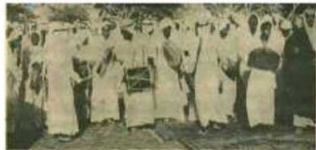
بتاسبة استقلال القطر الشقيق، الجزائر، في يوم الأربعاء ٣ صفر، الموافق ٤ يوليو، احتفلت المملكة العربية السعودية عامة بهذا اليوم الحيد، فلبست الزينات في مختلف المدن، ورفع علم الجزائر المجاهدة عالياً، وعبر الشعب السعودي عن الفرح والاحتفالات التي ألهمها في كل مكان. والصورة ترى أحد مظاهر السجدة في المنطقة الشرقية