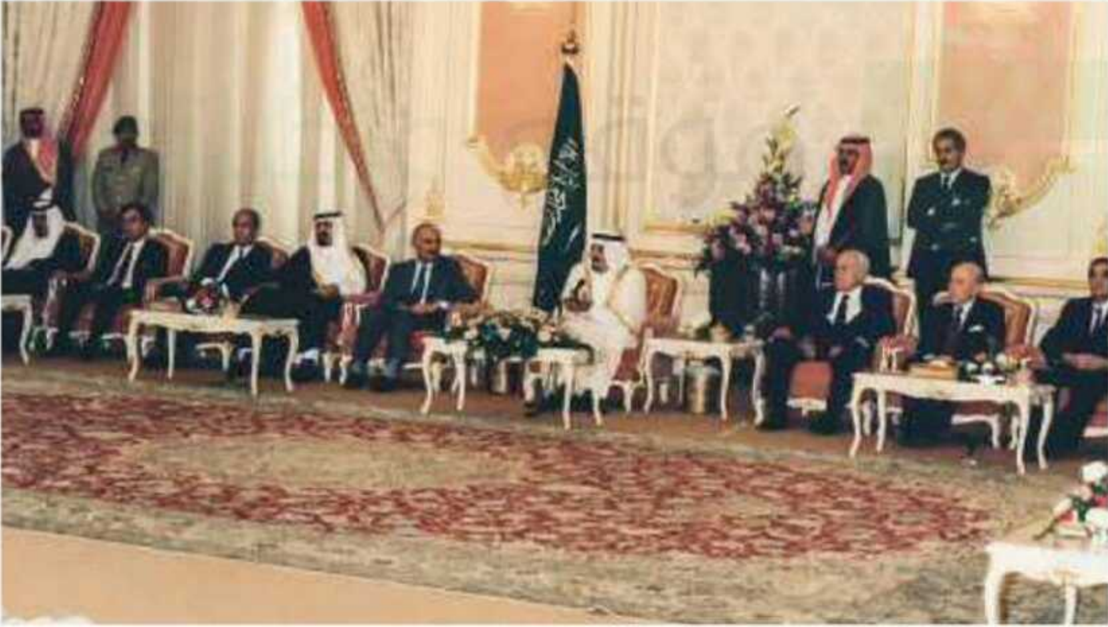
▲ لقاء الملك فهد بن عبدالعزيز بأعضاء مجلس النواب اللبناني في الطائف عام ١٤١٠هـ.

وفي عام ١٤١٠هـ أصدرت اللجنة الثلاثية بيان جدة، وكان من ضمن قراراتها دعوة أعضاء مجلس النواب اللبناني إلى الاجتماع، لإعداد وثيقة الوفاق الوطني في مدينة الطائف. عُقد الاجتماع الاستثنائي لمجلس النواب اللبناني في مدينة الطائف، وأقرت وثيقة الوفاق الوطني اللبناني المعروفة بـ(اتفاق الطائف)، في نجاح كبير ومميز للسياسة السعودية. وبهذا تكون الدبلوماسية السعودية المتفردة قد حققت أكبر إنجاز سياسي لخدمة لبنان من خلال تهيئة (اتفاق الطائف)، وتحقيق الأمن والاستقرار في أراضيه.