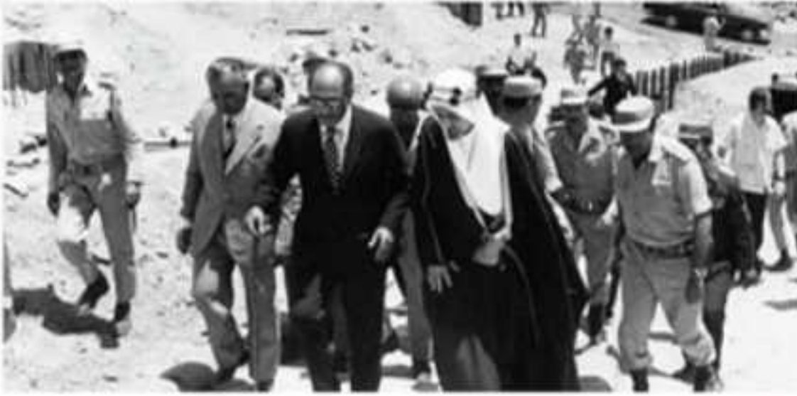
⚠️ الملك فيصل والرئيس المصري يتفقان خط برليف عام ١٣٩٢هـ.

وعلى إثر العدوان الإسرائيلي على مصر وسوريا والأردن عام ١٣٨٧هـ، دعا الملك فيصل بن عبدالعزيز زعماء العرب إلى الوقوف إلى جانب مصر والأردن، وأمر بتخصيص دعم مالي كبير لهما.