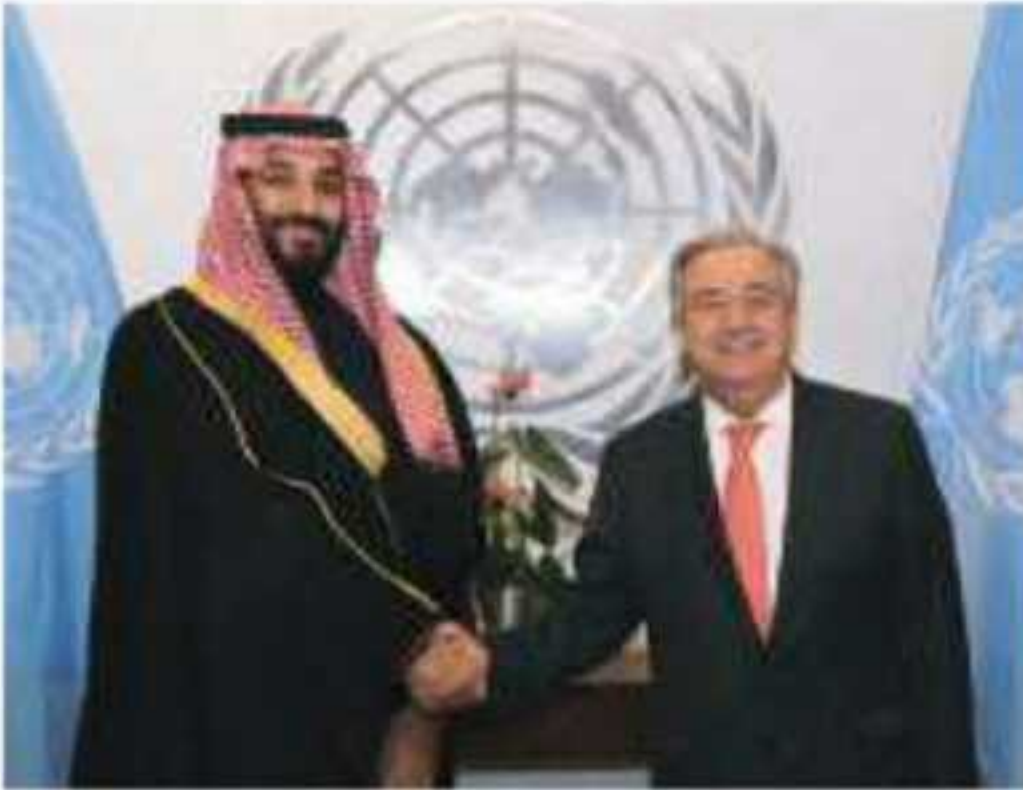
⚠️ صاحب السمو الملكي الأمير محمد بن سلمان بن عبدالعزيز آل سعود في لقاء مع الأمين العام لهيئة الأمم المتحدة السيد أنطونيو غوتيريس عام ١٤٣٩هـ

عندما أعلنت الحرب العالمية الثانية في عام ١٣٥٨هـ / ١٩٣٩م التزم الملك عبدالعزيز ﷺ الحياد في هذه الحرب حفاظاً على بلاده ومقدساتها، وعبر لقاءات عدة واجتماعات متواصلة إبان الحرب العالمية الثانية تقرّر عقد مؤتمر لتأسيس الأمم المتحدة في مدينة سان فرانسيسكو بالولايات المتحدة الأمريكية،