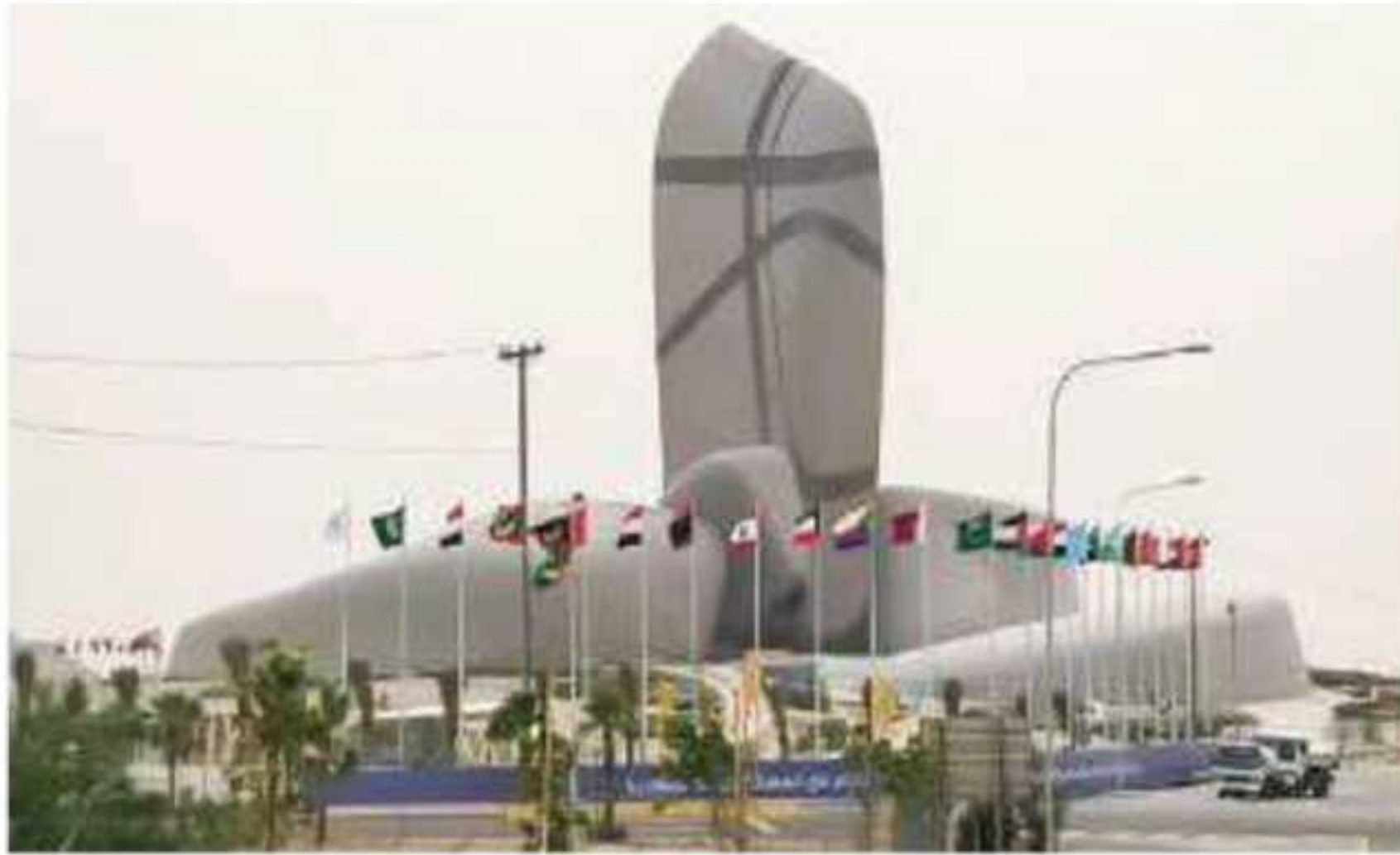
▲ مركز الملك عبدالعزيز الثقافي العالمي بالظهران حيث تم عقد القمة العربية عام ١٤٢٩هـ

«إيماناً منا بأن الأمن القومي العربي منظومة متكاملة لا تقبل التجزئة، فقد طرحنا أمامكم مبادرة للتعامل مع التحديات التي تواجهها الدول العربية بعنوان (تعزيز الأمن القومي العربي لمواجهة التحديات المشتركة)، مؤكداً على أهمية تطوير جامعة الدول العربية ومنظومتها، كما نرحب بما توافقت عليه الآراء بشأن إقامة القمة العربية الثقافية، آمليين أن تسهم في دفع عجلة الثقافة العربية الإسلامية».