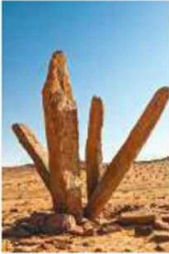
▲ أعمدة الرجاويل بالجوف

وشهدت المملكة العربية السعودية حضارات مختلفة، وعاش على أراضيها أقوام مثل قوم ثمود في منطقة العلا شمال المدينة المنورة، وقوم عاد في جنوب الربع الخالي، وغيرها.