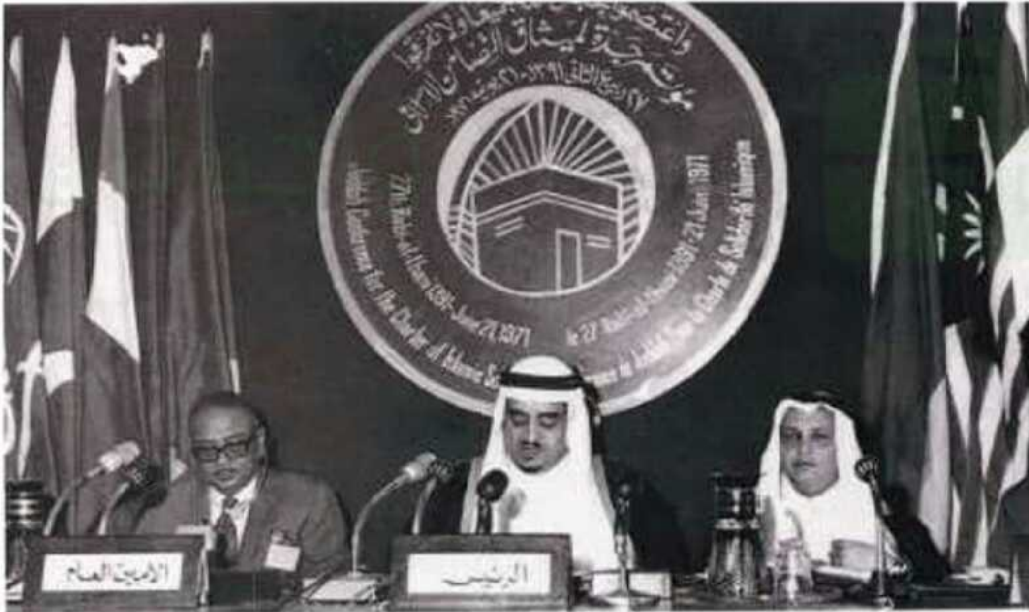
الملك فهد بن عبد العزيز يترأس جلسات مؤتمر جدة لميثاق التضامن الإسلامي عام ١٣٩١هـ

لم تقف جهود المملكة على دعم التضامن الإسلامي، بل تعدت ذلك، حيث قدمت المملكة للعالم الإسلامي من طريق صندوق النقد الدولي تسهيلات بلغت قيمتها مليارات الدولارات، كانت حصة المملكة منها ٤٥٪ من قيمة تلك القروض والتسهيلات، وذلك في سبيل دعم القضايا الإسلامية، إضافة إلى مليار دولار خصصتها المملكة عام ١٣٩٥هـ لمساعدة التنمية في إفريقيا.