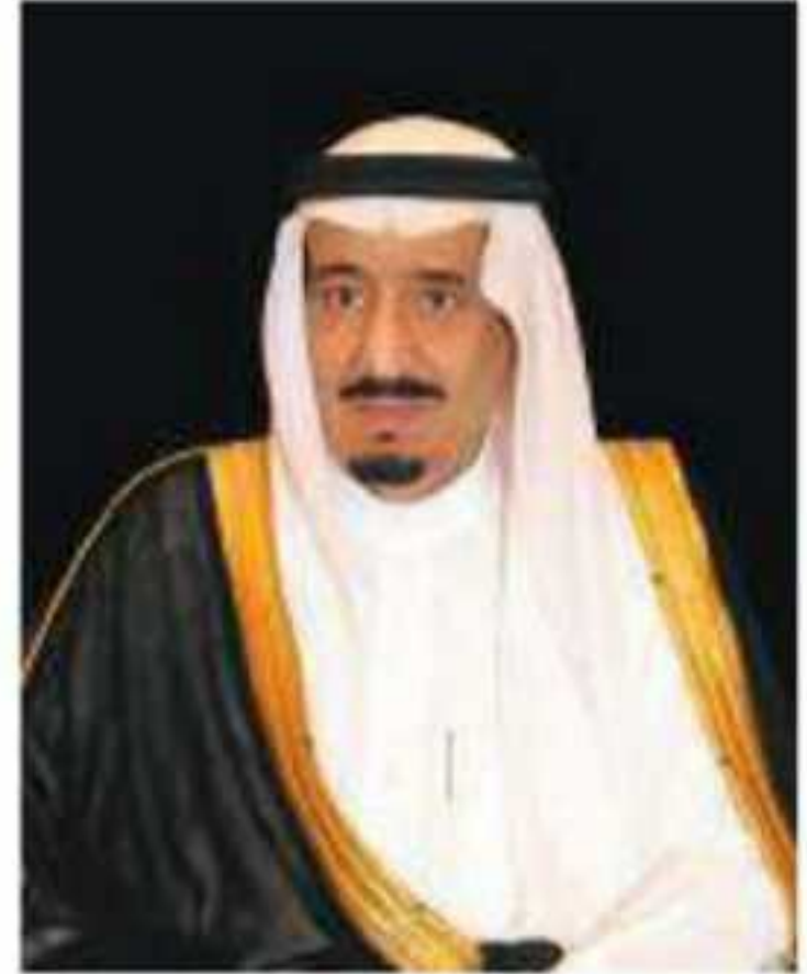
▲ خادم الحرمين الشريفين الملك سلمان بن عبدالعزيز آل سعود ملك المملكة العربية السعودية