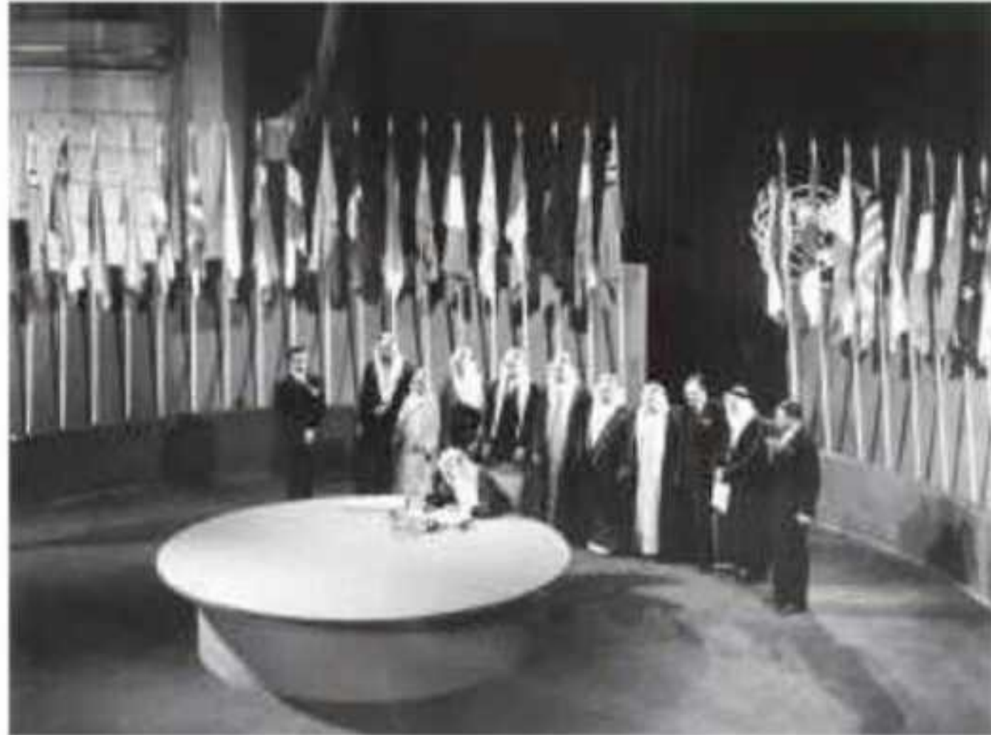
الأمير فيصل بن عبدالعزيز يوقع ميثاق هيئة الأمم المتحدة في سان فرانسيسكو عام 1364هـ