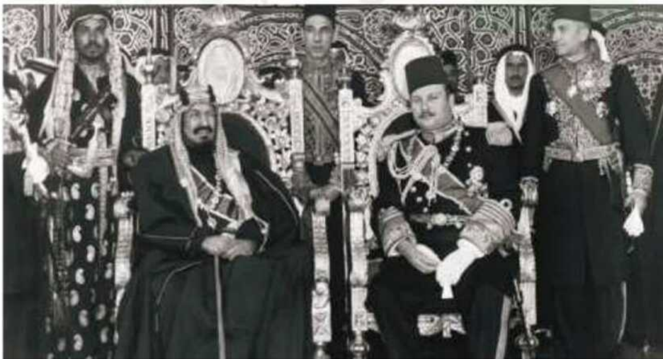
▲ زيارة الملك عبدالعزیز إلى مصر عام ١٣٦٥هـ

وعندما هاجم مصر العدوان الثلاثي عام ١٣٧٦هـ وقفت المملكة العربية السعودية مع مصر بكل ثقلها، وقدمت لمصر دعماً مالياً كبيراً، وقدمت لها عشرين طائرة حربية، كما استضافت طائراتها التي لجأت إلى المملكة إثر كثافة غارات الأعداء عليها.