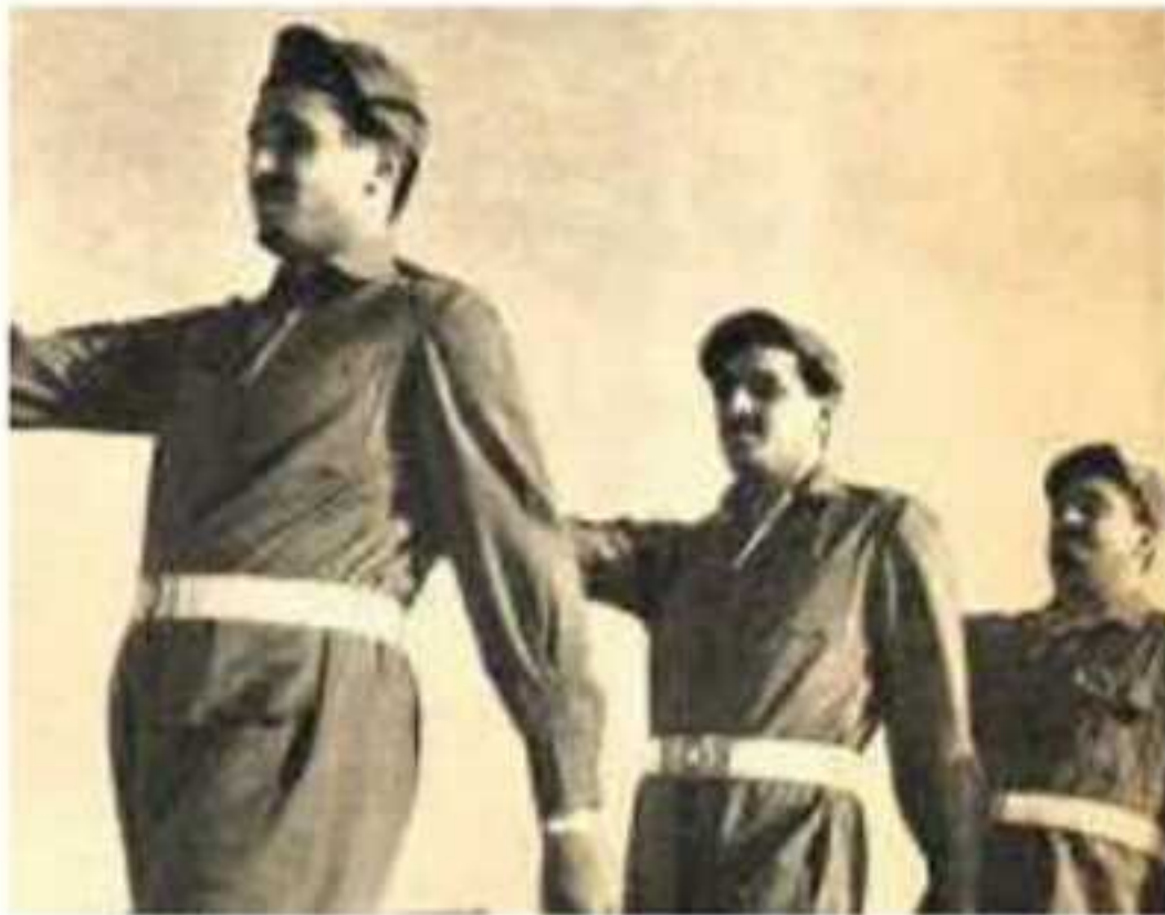
⚠️ تطوع الملك فهد بن عبد العزيز وخادم الحرمين الشريفين الملك سلمان بن عبد العزيز للدفاع عن مصر أثناء العدوان الثلاثي عليها عام ١٣٧٦هـ / ١٩٥٦م

وفي عام ١٤٣٧هـ زار خادم الحرمين الشريفين الملك سلمان بن عبدالعزيز مصر ووقع عدة اتفاقيات لتنفيذ عدد من المشروعات، من أهمها: إنشاء جامعة الملك سلمان بن عبدالعزيز في طور سيناء، والتجمعات السكنية ضمن برنامج الملك سلمان بن عبدالعزيز لتنمية شبه جزيرة سيناء، وإنشاء جسر يربط بين البلدين عبر سيناء.