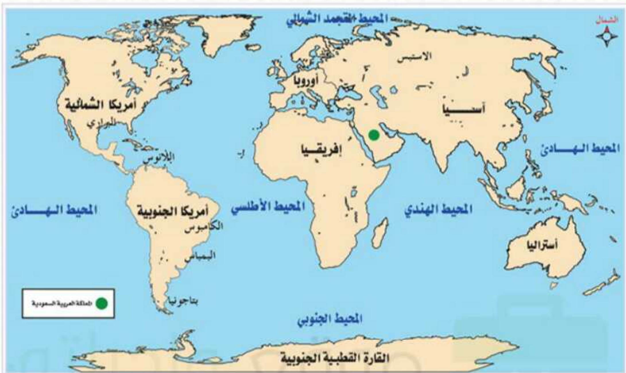
▲ موقع المملكة العربية السعودية من العالم