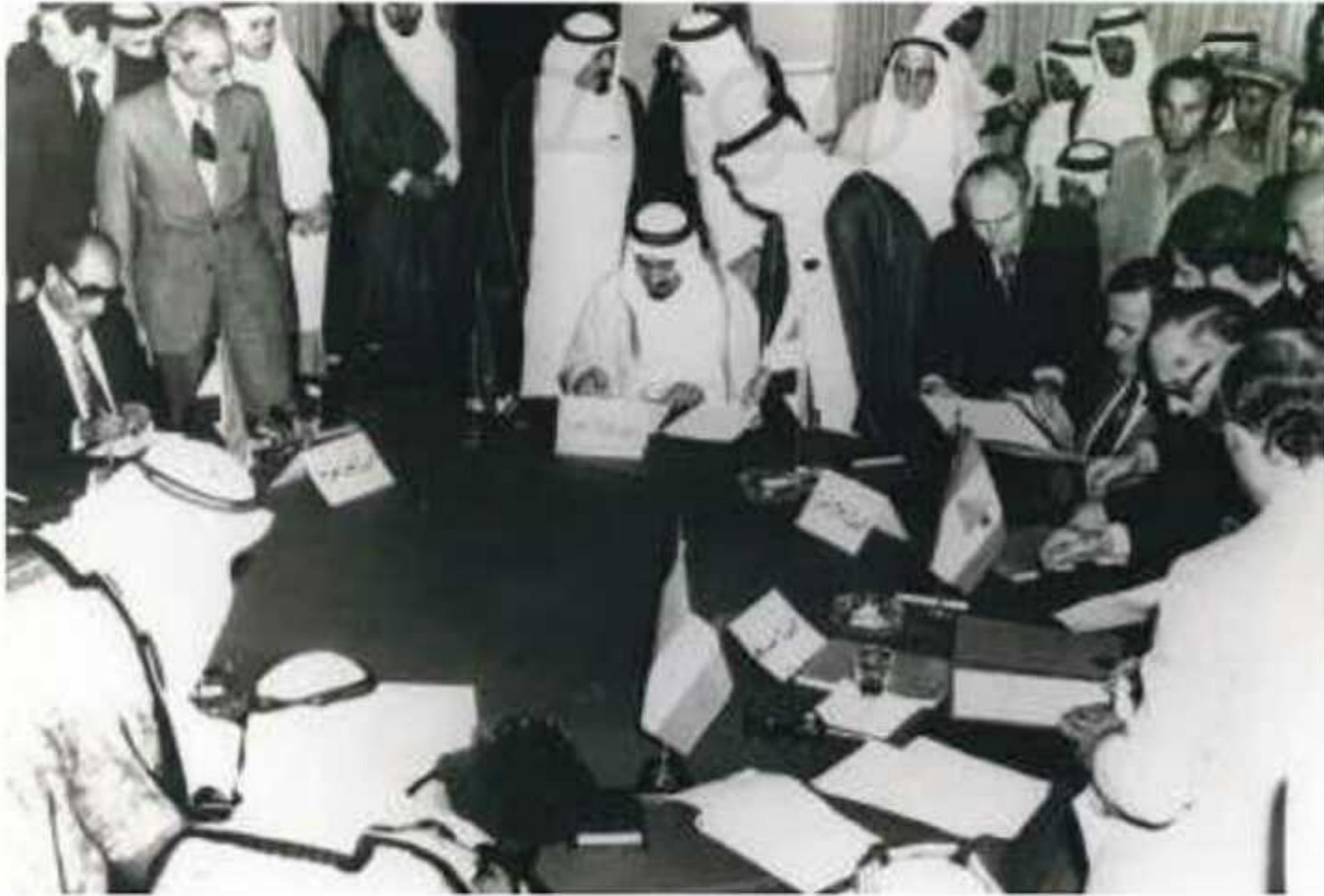
▲ مؤتمر القمة العربي المصغر لبحث الأزمة اللبنانية عام ١٣٩٦ في الرياض

وعندما تفاقم الصراع عام ١٤٠٩هـ عُقد مؤتمر طارئ في المغرب لوضع آلية للوصول إلى تسوية للصراع اللبناني، تمثلت في تشكيل لجنة ثلاثية تضم الملك فهد بن عبدالعزيز والملك المغربي والرئيس الجزائري؛ تكون مهمتها الأساسية القيام بالاتصالات والإجراءات التي تراها مناسبة بهدف توفير المناخ الملائم لدعوة أعضاء مجلس النواب اللبناني لمناقشة وثيقة الإصلاحات السياسية، وإجراء انتخابات رئاسية الجمهورية وتشكيل حكومة الوفاق الوطني في مدة أقصاها ستة أشهر.