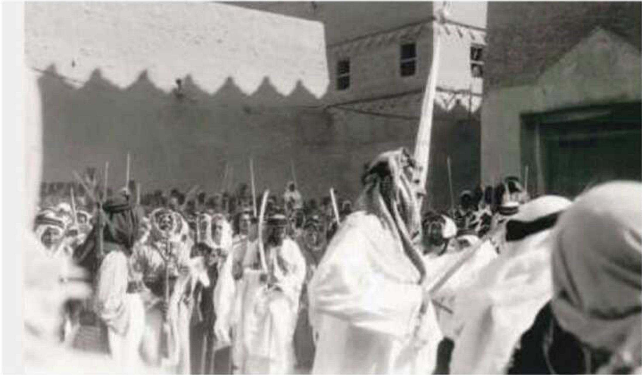
▲ الملك عبدالعزيز وهو يؤدي العرضة مع المواطنين عام ١٣٧٠هـ

ويقوم المجتمع السعودي على أساس من اعتصام أفراده بحبل الله، وتعاونهم على البر والتقوى، والتكافل بينهم، واجتناب تفرقهم، وتعزيز الوحدة الوطنية في النفوس، وتمنع الدولة كل ما يؤدي إلى الفرقة والفتنة والانقسام.