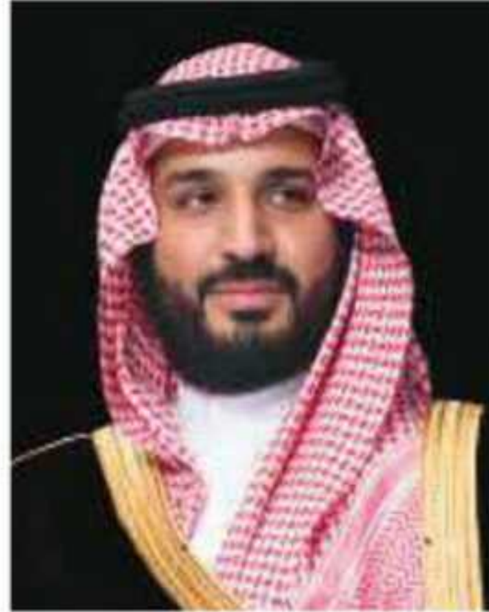
▲ صاحب السمو الملكي الأمير محمد بن سلمان بن عبدالعزيز آل سعود ولي العهد، نائب رئيس مجلس الوزراء، وزير الدفاع

وهذا من أهم مقومات المملكة العربية السعودية من حيث أساسها السياسي المستقر والقائم على مبادئ إسلامية، وتاريخها العريق الأصيل على أرض الجزيرة العربية، وكذلك اعتماد النظام الملكي على البيعة، وهو مبدأ إسلامي أصيل، يؤدي إلى الاستقرار وتحقيق المصالح العامة شرعاً ومصدرًا.