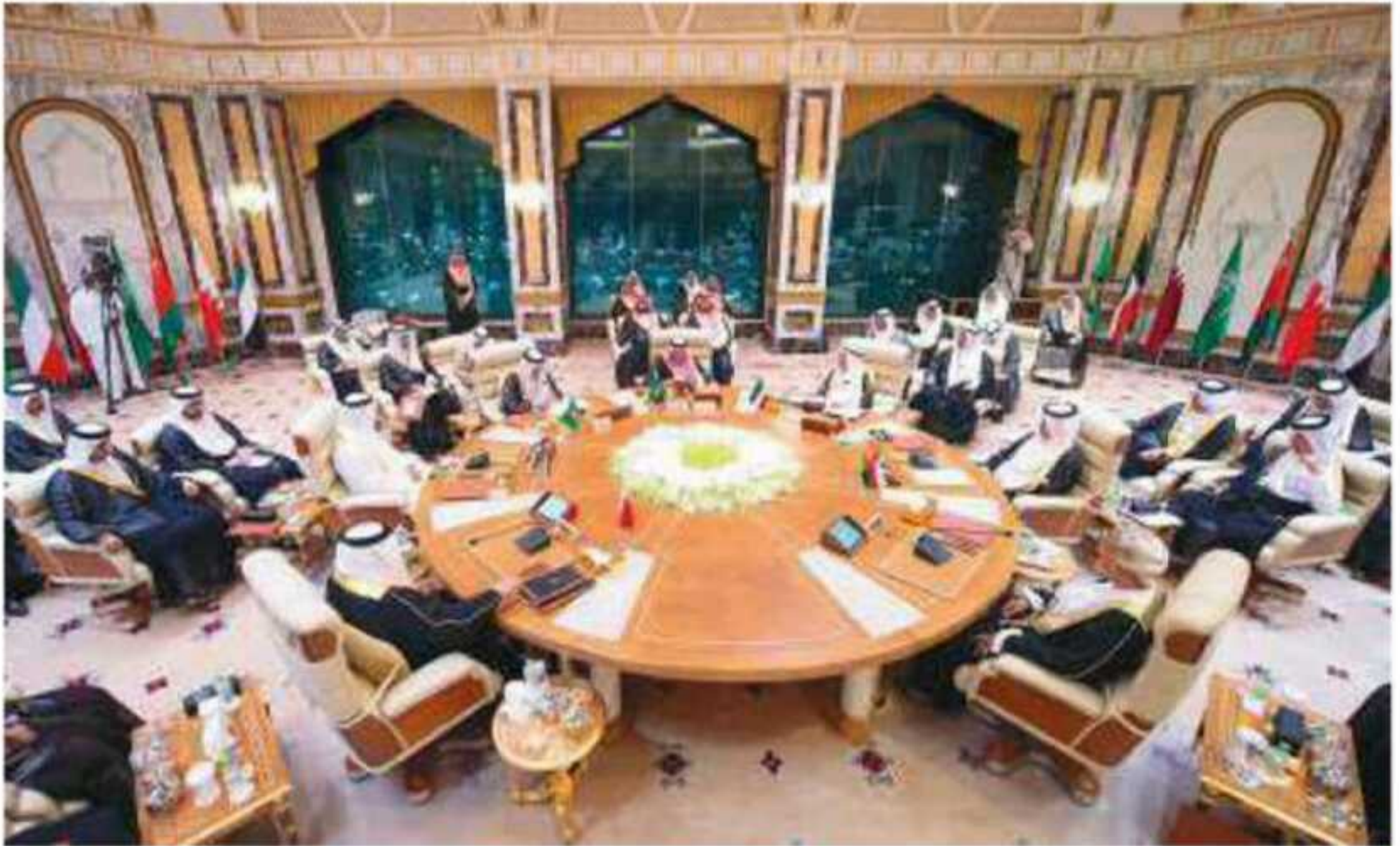
▲ قمة مجلس التعاون لدول الخليج العربية في مكة المكرمة عام ١٤٤٠هـ.

والتكامل والترابط بينها في جميع الميادين. دول الخليج يربطها بالعالم واشرافها على مضيق هرمز المهم ودول الخليج متوسطة بين قارات جول العالم القديم