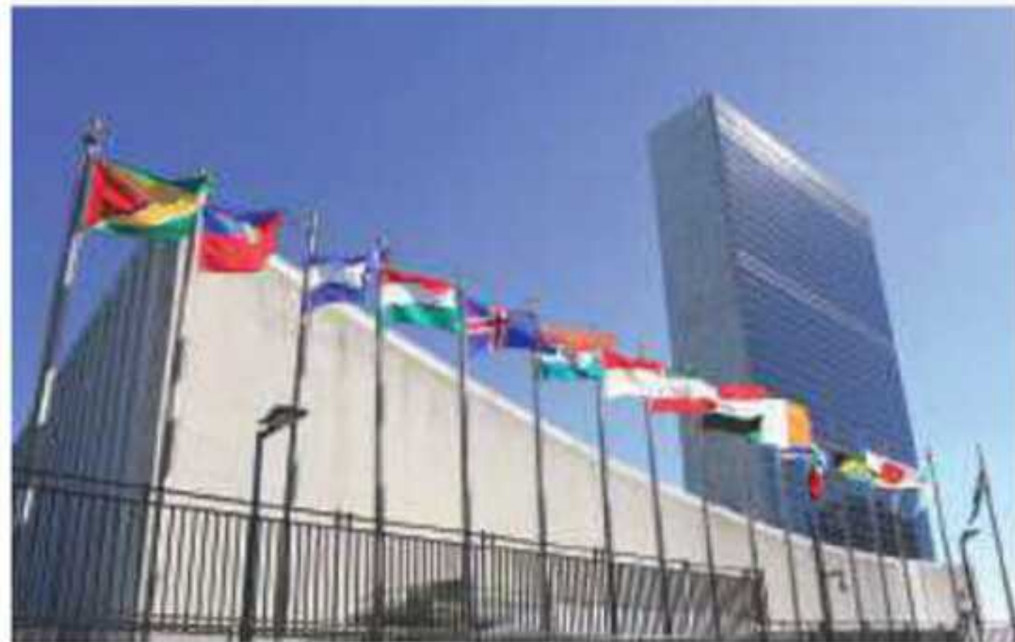
▲ مبنى هيئة الأمم المتحدة في نيويورك