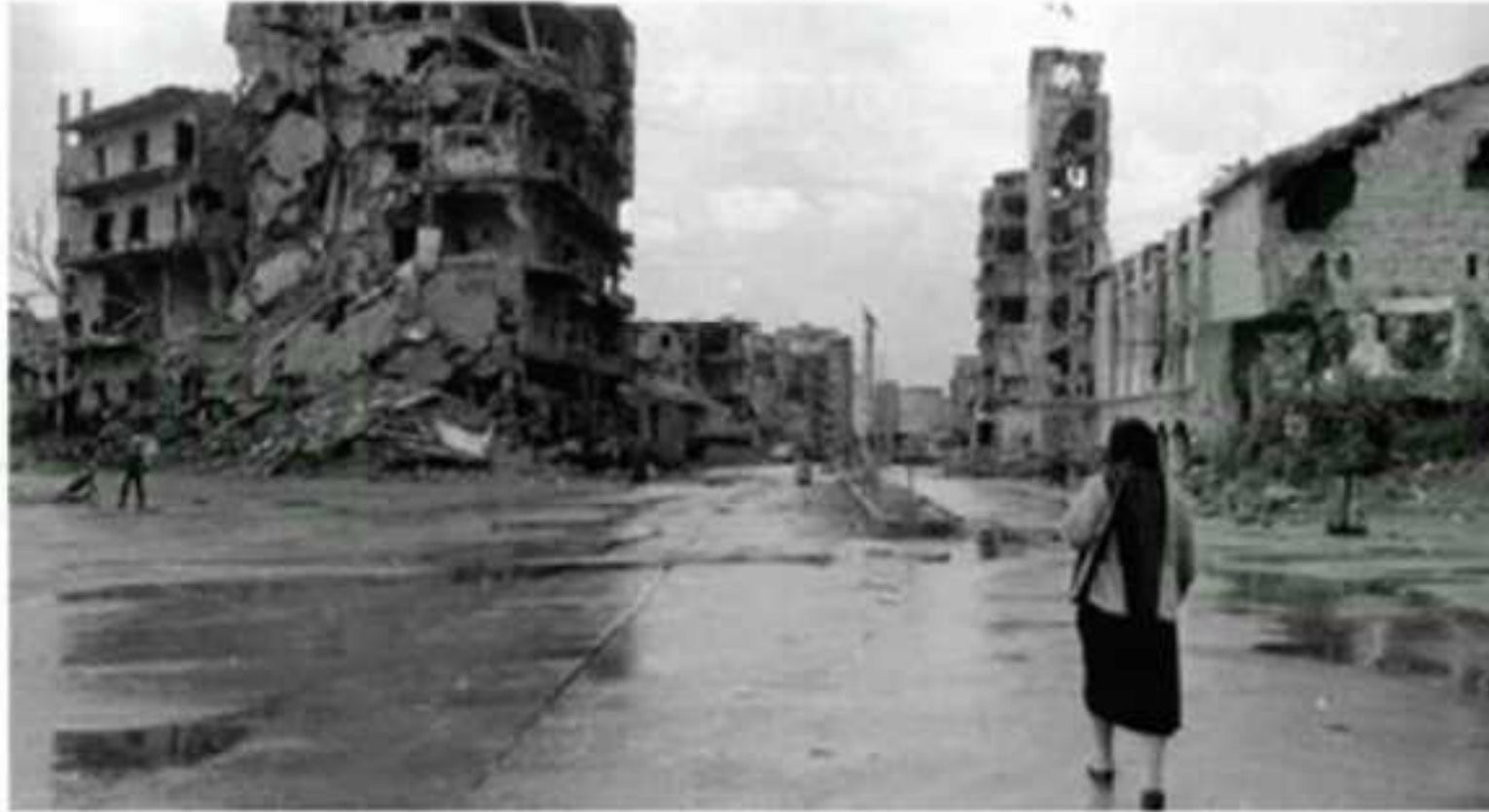
⚠️ الحرب اللبنانية

وبعد احتلال إسرائيل لفلسطين عام ١٣٦٨هـ نزح فلسطينيون كثيرون إلى لبنان، فأدى ذلك إلى تغيير في التركيبة السكانية لمصلحة الفئة المسلمة، وهو ما أدى إلى اشتعال فتيل القتال عام ١٣٩٥هـ بين الموارنة والقوات الفلسطينية، وانضم إلى كل فريق جماعات ومناصرون من داخل البلاد من الطوائف الأخرى، ومن خارجها مثل سوريا والعدو الإسرائيلي.