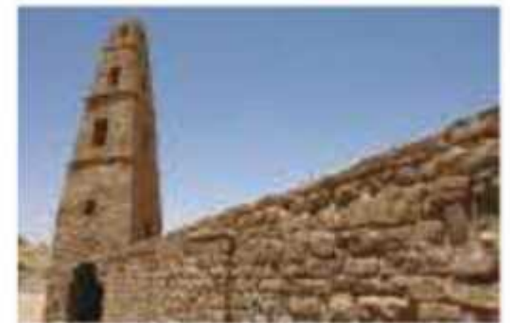
▲ مسجد عمر بن الخطاب رضي الله عنه في دومة الجندل