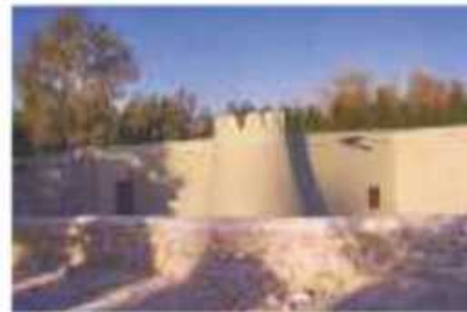
▲ مسجد جَوَّانا بالقرب من مدينة الهفوف بالأحساء