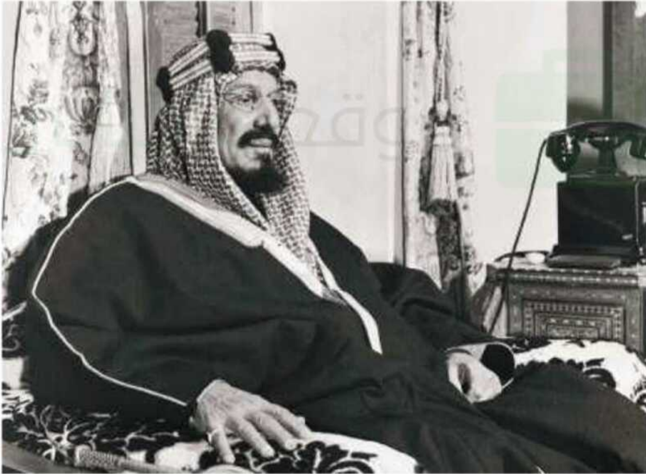
الملك عبدالعزيز بن عبدالرحمن آل سعود

وللمملكة العربية السعودية علاقات تعاون مع الدول الصديقة، وتحظى باحترام وتقدير متبادل، كما أن لها دوراً فاعلاً في القرارات الدولية، وهي عضو في كثير من الهيئات الدولية، ومن الأعضاء المؤسسين لهيئة الأمم المتحدة عام ١٩٤٥م.