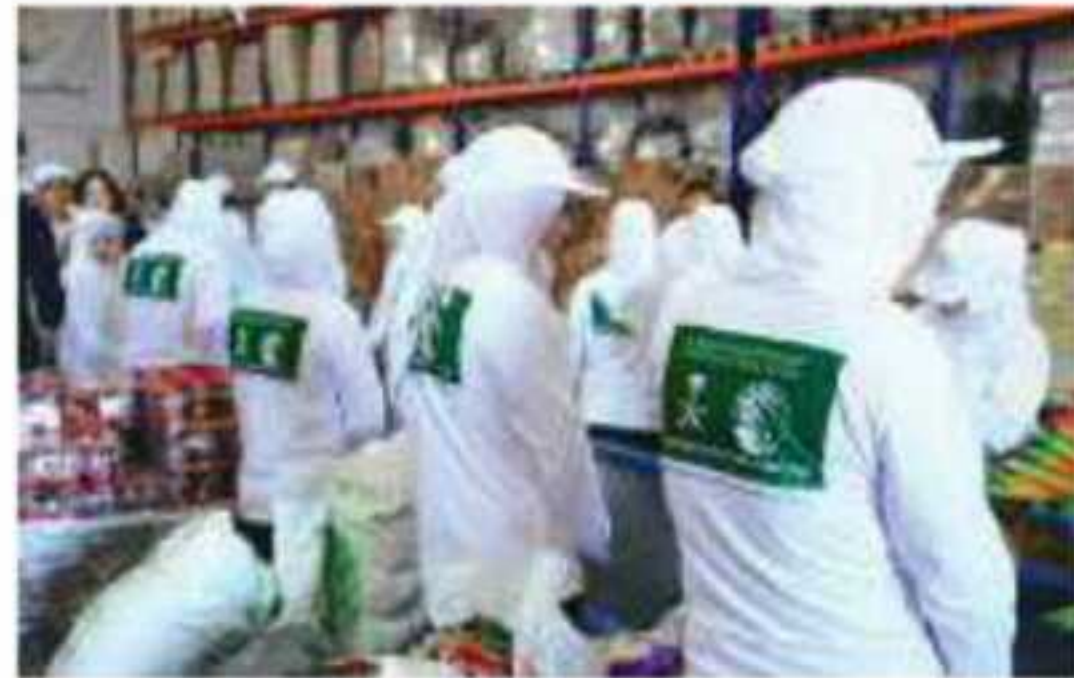
▲ صور من جهود المملكة العربية السعودية في الأعمال الإغاثية