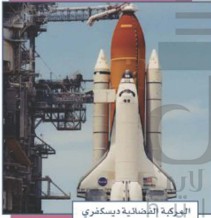
المركبة الفضائية ديسكفري

تعد الأرض مسكناً لملايين الأنواع من الكائنات الحية: (الإنسان والحيوان والنبات)، وهي المكان الوحيد الذي توجد فيه الحياة بين سائر كواكب الكون، فما شكل الأرض الحقيقي، أهى مسطحة أم بيضوية أم كروية؟ وما أبعادها؟