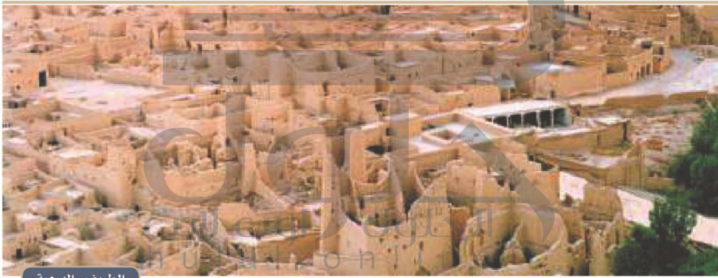
الطريف - الدرعية