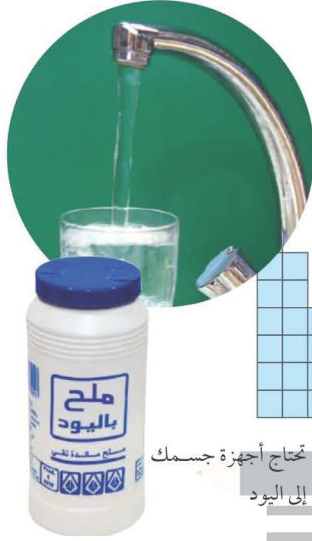
المجموعة ١٧ مجموعة الهالوجينات