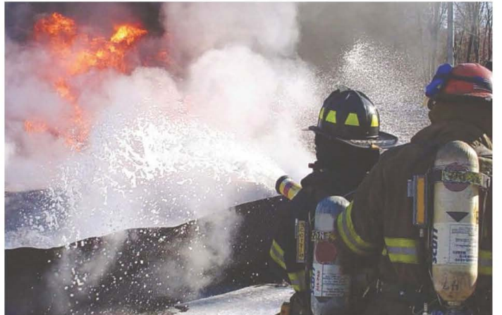
الشكل ١٠ تشكّل الرغوة طبقة عازلة للأكسجين فتحاصر النيران.

أما الكبريت فهو لافلز صلب، أصفر اللون، يستخدم بكميات كبيرة في صناعة حمض الكبريتيك، الحمض الأكثر استخداماً في العالم، والذي يتكوّن من اتحاد الكبريت والأكسجين والهيدروجين؛ حيث يستخدم حمض الكبريتيك في الكثير من الصناعات، ومنها صناعات الطلاء والأسمدة والمنظفات والأنسجة الصناعية والمطاط. أما السيلينيوم فهو موصل للكهرباء عند تعرضه للضوء، ولذلك يستخدم في الخلايا الشمسية وعدادات الضوء. ونظراً إلى شدة حساسيته للضوء يستخدم في آلات التصوير الضوئي.